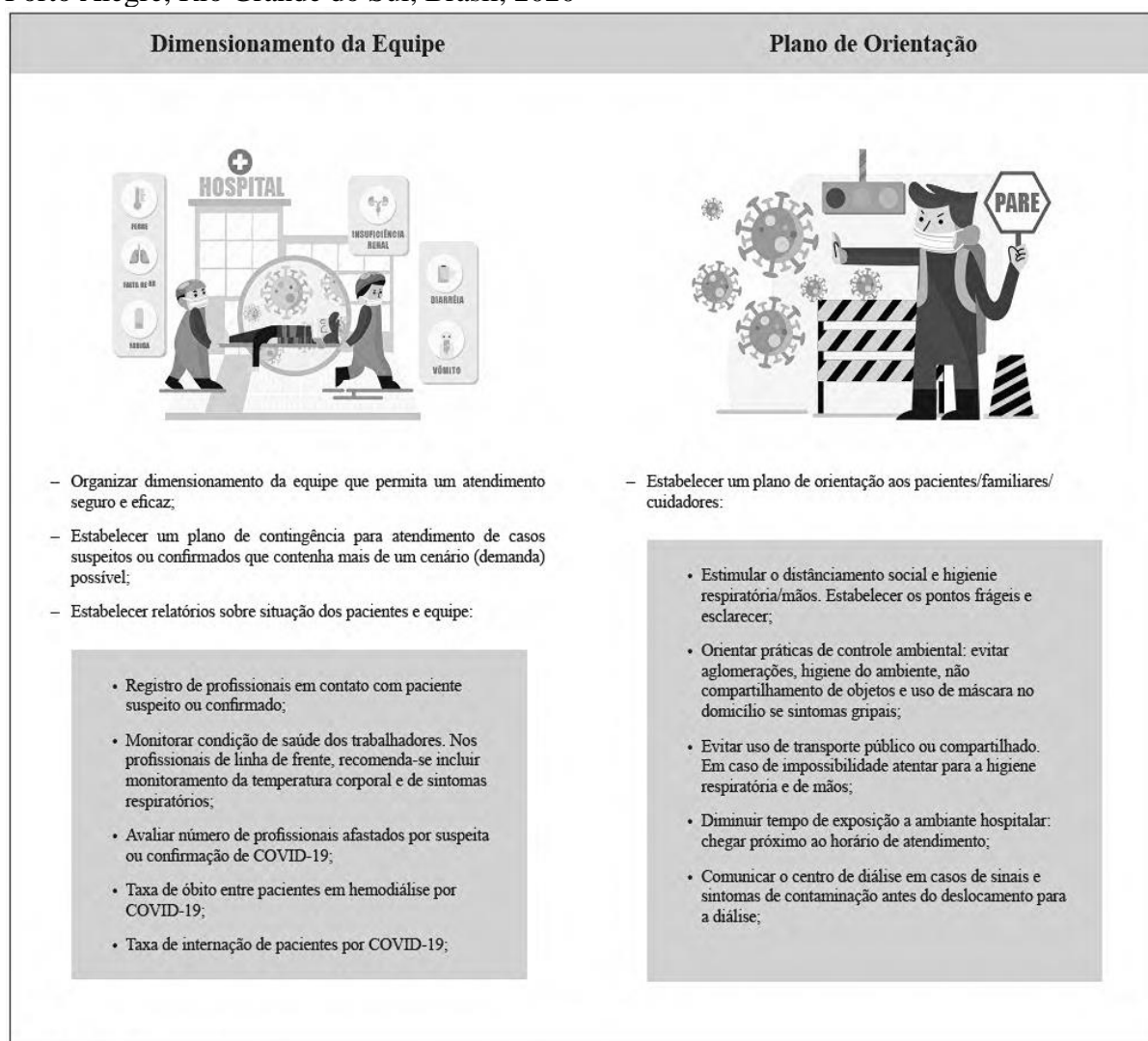
Figura 3 - Plano gerencial para centros de hemodiálise em atendimento de casos COVID-19. Porto Alegre, Rio Grande do Sul, Brasil, 2020

Em virtude do caráter dinâmico da pandemia, orientações diárias às equipes e pacientes foram necessárias durante a aplicação preliminar do protocolo. Desta forma, foi previsto um plano de orientação para definir cuidados a serem realizados pelos pacientes, familiares e cuidadores. Para tanto, as equipes assistências receberam instruções durante as passagens de plantões ou reuniões em plataformas online . Já a educação em saúde do paciente ocorreu em rodas de conversa com pequenos grupos, por turnos, nas salas de espera da hemodiálise, o que facilitou a compreensão destes no que tange as mudanças frente as recomendações epidemiológicas. Sendo assim, o “Plano gerencial para centros de hemodiálise em atendimento de casos COVID-19” foi elaborado contemplando aspectos como orientação dos usuários do serviço de saúde, plano de contingência, relatórios sobre condições de saúde dos pacientes e equipe e dimensionamento de pessoal (Figura 3).