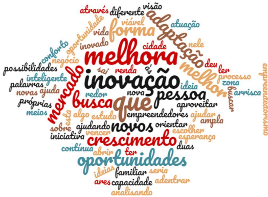
Figura 1 - Nuvem de palavras elaborada a partir da definição pessoal de empreendedorismo dos respondentes

Que ajuda no crescimento da cidade ajudando na renda familiar(R14).