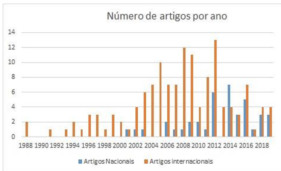
Figura 3 - Artigos nacional e internacional por ano de publicação

A distribuição dos artigos nacionais e internacionais, por ano de publicação, pode ser observada no gráfico representado na Figura 3.