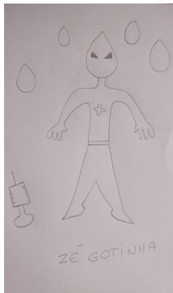
Figura 3 - Desenho de Pedro

Enquanto para ela o vírus é sempre uma ameaça à espreita, o desenho e a reflexão de Pedro, no entanto, revelam a presença imaginada de um outro inimigo.