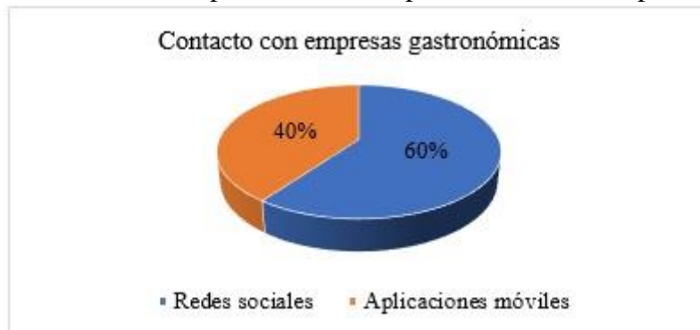
Figura 7: Preferencia de clientes para contactarse con empresas gastronómicas