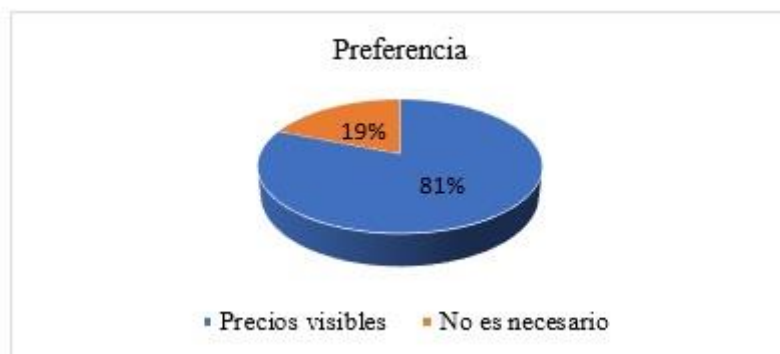
Figura 5: Precios visibles en redes - Consumidores