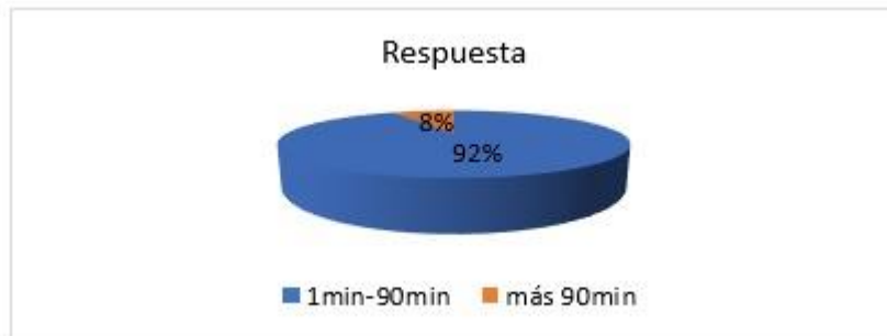
Figura 2: Tiempo de respuesta – WhatsApp