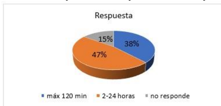
Figura 3: Tiempo de respuesta – Facebook