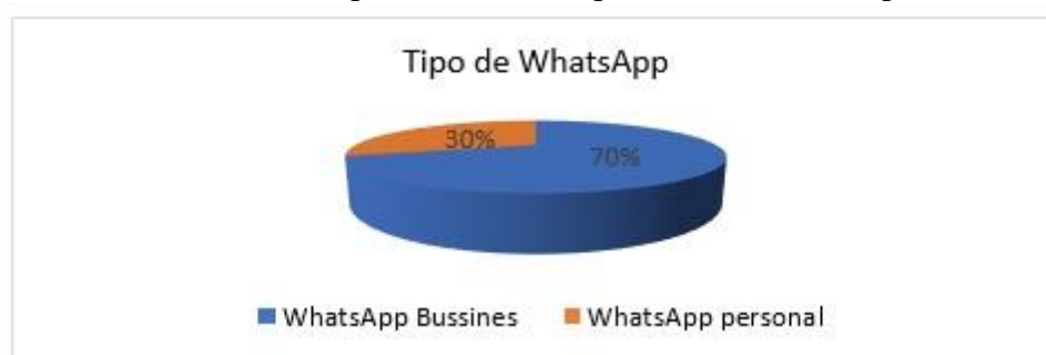
Figura 1: Tipos de WhatsApp utilizados por empresas gastronómicas