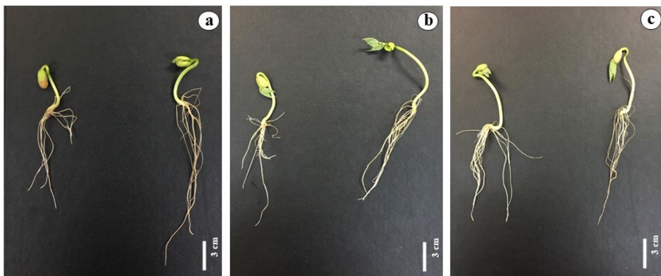
Figura 2. Plântulas resultantes dos diferentes métodos de aplicação dos extratos das algas, embebição (T1) e 48 horas (T2), respectivamente. a. controle (água); b. extrato de Ascophyllum nodosum (L.) Le Jol.; c. extrato de Scenedesmus acuminatus (Lagerh.) Chodat.