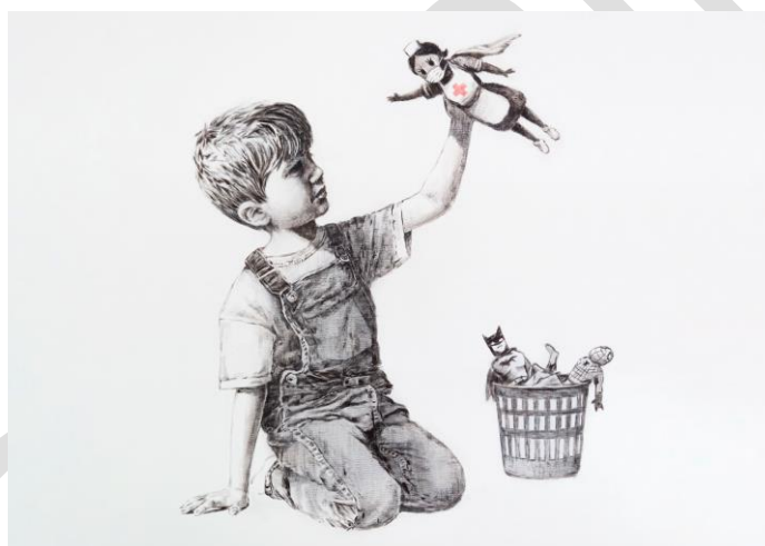
Figura 3 - Game Changer. Obra de Banksy

Fonte: Casbas Maria. La nueva obra de Banksy es un homenaje a los profesionales sanitarios Condé Nast Traveler. Viajes Urbanos, 7/5/2020.