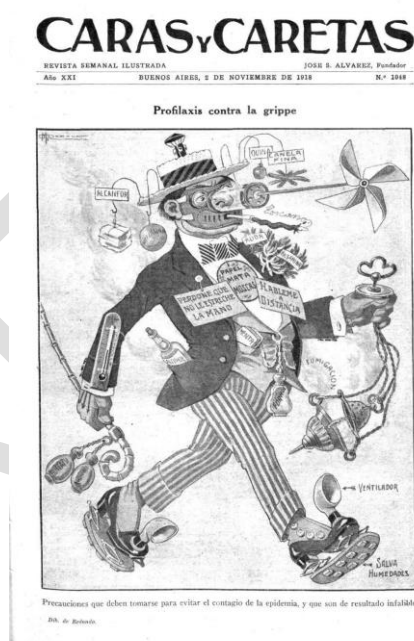
Figura 1- Profilaxis contra la gripe