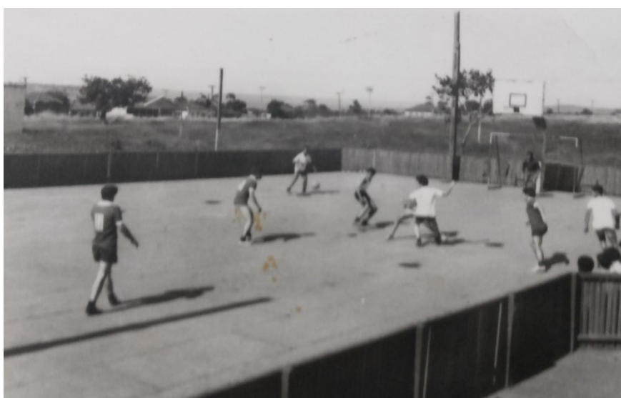
Figura 03: Futebol masculino Instituto Samuel Graham (1977).