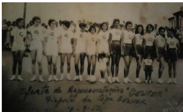
Figura 09: Time de futebol de salão feminino – Instituto Granbery (s/d).