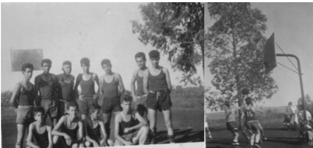
Figura 07: Time de basquete masculino – Instituto Granbery (s/d).