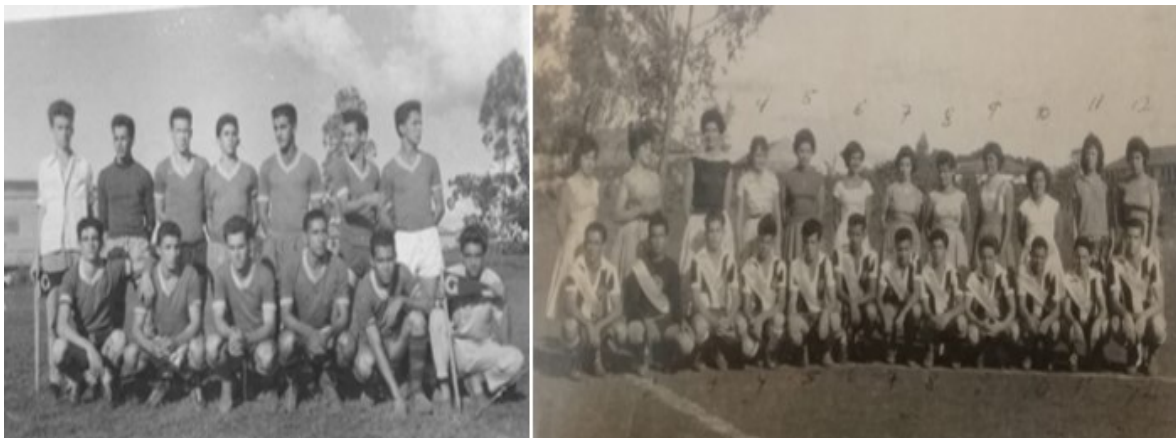
Figura 06: Times de futebol masculino – Instituto Granbery (s/d).