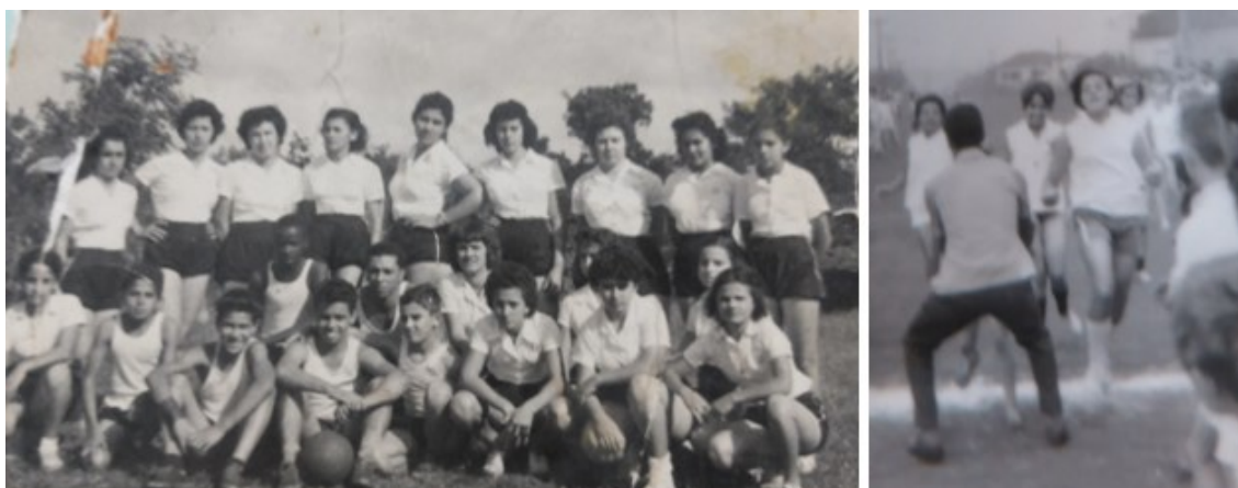
Figura 04: Esportistas Instituto Samuel Graham (s/d).