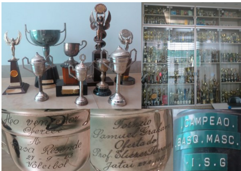
Figura 10: Galeria de troféus – Instituto Samuel Graham (2019).