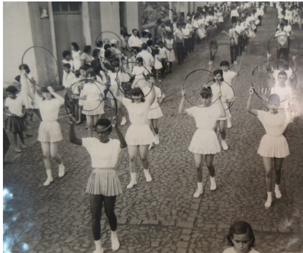
Figura 05: Ginastas – Desfile cívico Instituto Samuel Graham (s/d).