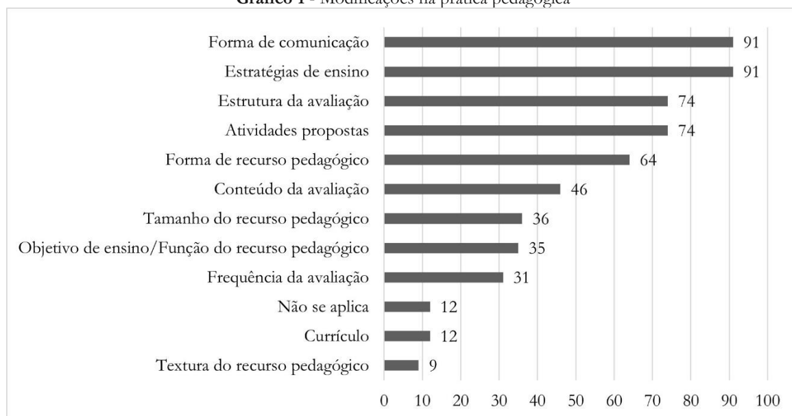
Gráfico 1 - Modificações na prática pedagógica

No contexto da pesquisa, 123 (78,8%) professores indicaram que faziam modificações na sua prática pedagógica para trabalhar com o estudante PAEE durante o ensino remoto, dos quais 97 (62,2%) as realizavam parcialmente. As modificações realizadas no modo de escolarização do aluno PAEE são apresentadas no Gráfico 1.