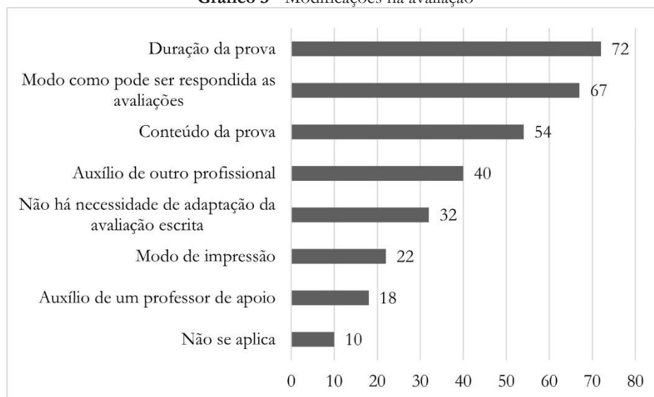
Gráfico 3 - Modificações na avaliação

Em relação ao processo de avaliação, Costas e Honnif (2015) apontaram que os docentes consideravam que a avaliação dos estudantes com PAEE, assim como dos demais estudantes com necessidades educativas, poderia ser mais bem planejada em parceria com o professor de educação de educação especial, pois estes aplicariam conhecimentos distintos que se unificariam na elaboração do processo avaliativo. Modificações realizadas nas avaliações escritas também foram relatadas no ensino remoto, conforme apresentado no Gráfico 3.