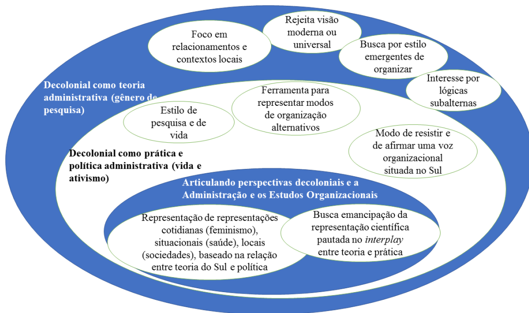
Figura 4 – Abordagens decoloniais na administração brasileira (2009-2018)