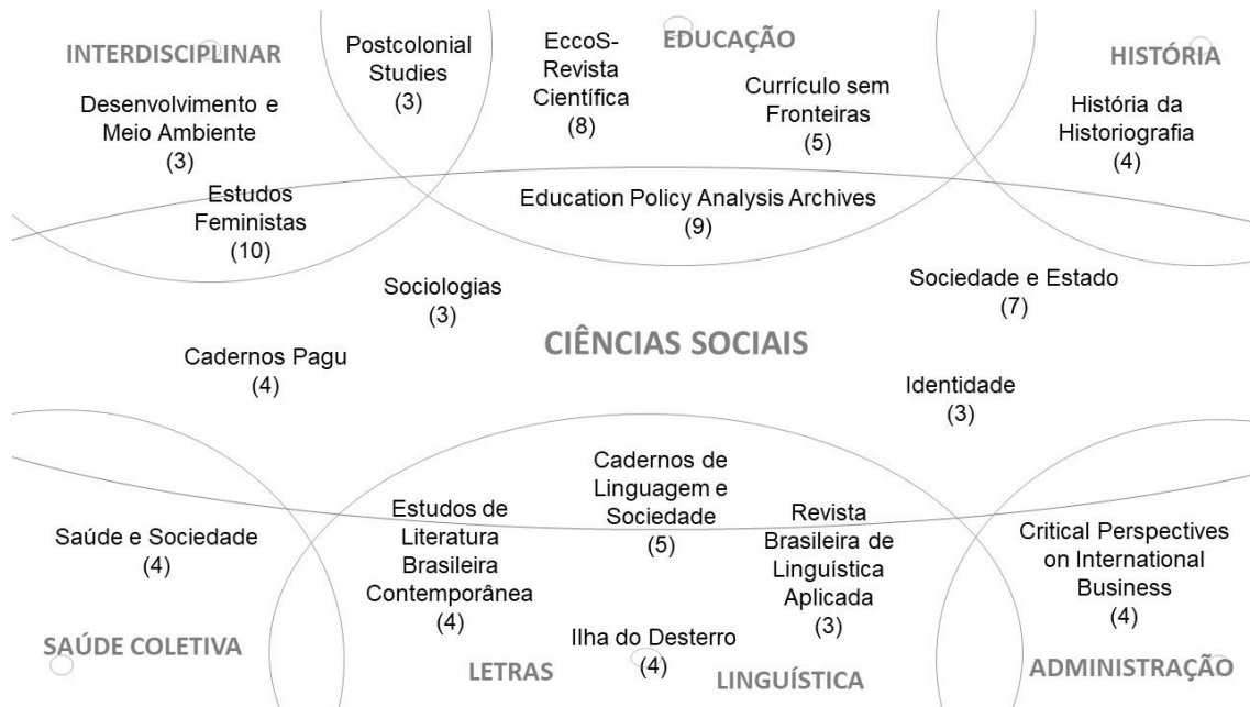
Figura 2 – Periódicos com maior volume de publicações sobre estudos decoloniais de autores brasileiros (2009-2018)