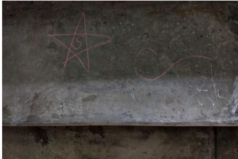
Imagem 13: Desenhos "clandestinos" sobre o concreto.

Conversei com os estudantes sobre um possível campo de possibilidades para o uso do espaço e implementação de práticas pedagógicas inovadoras. Algumas sugestões foram: o uso de áreas além da sala de aula para práticas pedagógicas, como a sala de leitura, quadra ou arquibancada; mensagens positivas e impessoais direcionadas à valoração da saúde mental e autoestima dos alunos (“coisas como um bilhete no espelho do banheiro dizendo ‘você é linda’”, sugestão de uma aluna do 6º ano); passeios educativos; palestras com profissionais diversos sobre temas diversos (a sugestão predominante foi a de psicólogos ou psiquiatras para um debate aberto sobre saúde mental); artes que explorem os vazios do corredor, como esculturas ou maquetes dispostas em uma narrativa linear, no centro do espaço. Esta última sugestão merece um olhar mais atento, visto que o corredor possui artes dispostas sobre si, como aquelas apresentadas nas imagens 8, 9, 10 e 14. Nas imagens 8 e 9, os cartazes não ocupam um vazio tão simbólico quanto aquele vivido constantemente no corredor, mas é compreensível que possuem certa importância em diversos níveis do desenvolvimento intelectual dos estudantes. Na Imagem 10, os cartazes estão pendurados no teto, o que impossibilita a leitura e análise destes pelos alunos do Ensino Fundamental I e II devido à altura. A Imagem 14 apresenta a ocupação completa de um espaço que potencialmente utilizável para práticas pedagógicas e que é utilizado para práticas socializadoras.