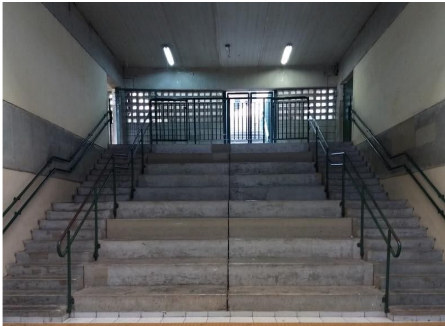
Imagem 12: Vista frontal da arquibancada e as escadas de circulação adjacentes.

neutralidade, pode ser que a escolha deste espaço de socialização ocorra puramente por motivos psicológicos e biológicos inconscientes. Entretanto, a relação entre o ciclo circadiano e a influência da luminosidade nos processos sociais do ser reservo para análises paralelas. Outra hipótese, mais simples, pode justificar a escolha deste espaço puramente pela ausência de lugares aconchegantes no corredor, como cadeiras e bancos. A presença próxima dos AOE, agentes de manutenção do poder e da ordem, pode ser outro fator que influi no desuso deste espaço.