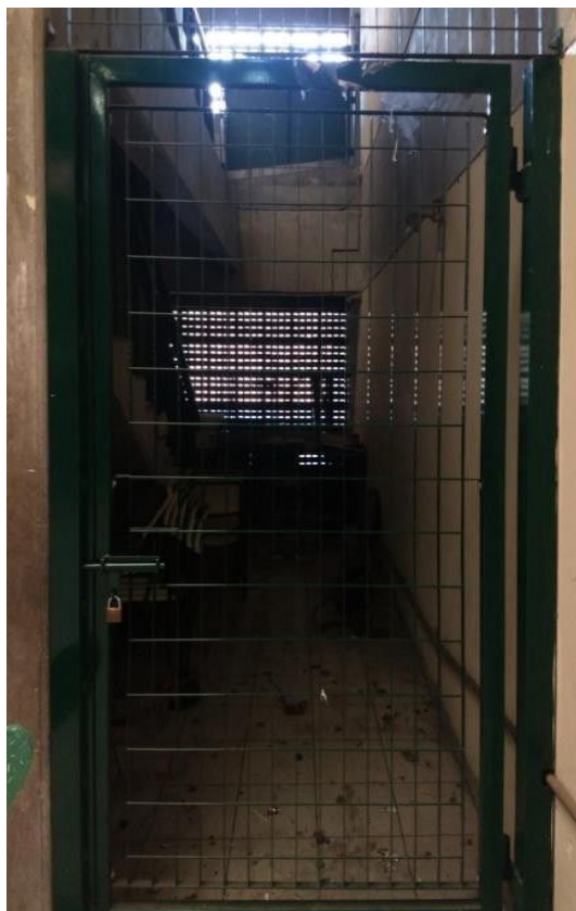
Imagem 6: Exemplo de zona morta. Destaque, também, ao brise em concreto bruto ao fundo, característico de edificações brutalistas.