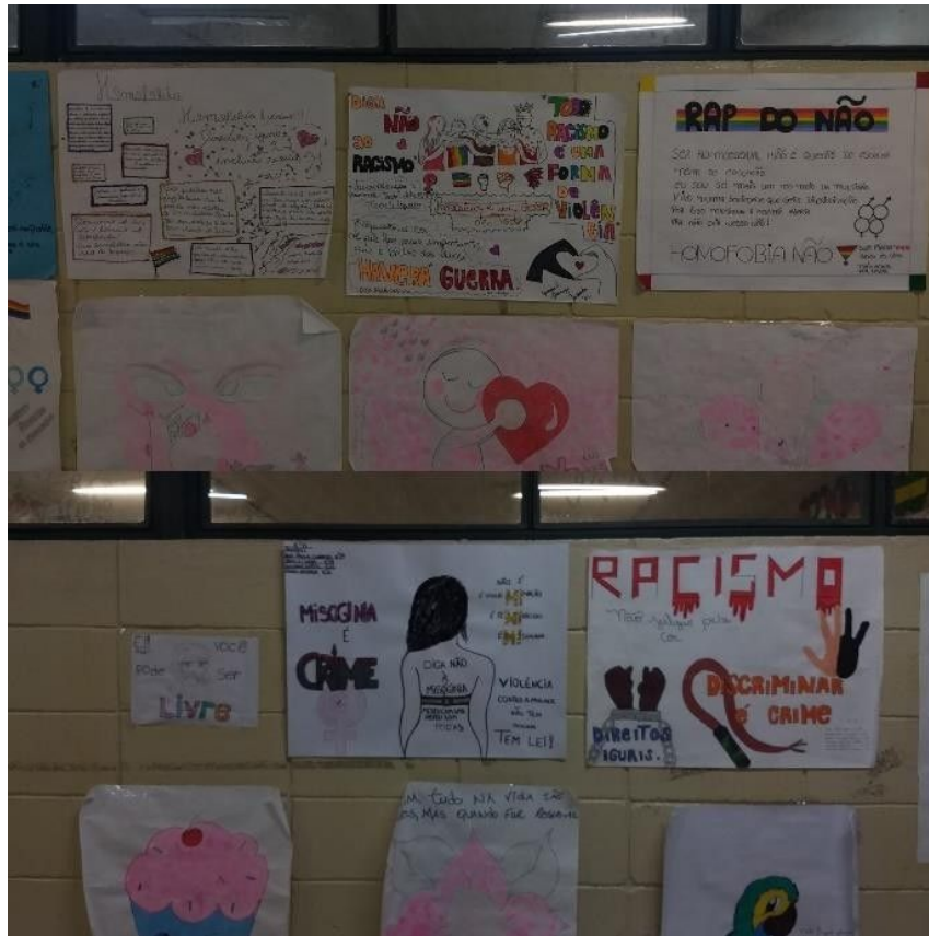
Imagem 8: Difusão de mensagens politizadas acerca da LGBTfobia, misoginia e racismo em trabalhos feitos pelos estudantes.

Zarankin (2001) aponta que, ao ter monopólio das políticas para projetar e construir a paisagem, o sistema inventa dispositivos para se autolegitimar e se reproduzir. Porém, não cabe somente ao sistema a determinação das pautas abordadas no seio de uma escola, visto que estas podem ser moldáveis de acordo com as necessidades socioculturais e disciplinares dos estudantes. É interessante apontar que a temática de muitos dos trabalhos apresentados foi sugerida pelos próprios discentes. Disto, depreende-se a ideia de que a escola esteja exercendo adequadamente sua função como vetor do pensamento crítico. O método de aplicação das ideias dos estudantes se parece, em diversos níveis, ao proposto por Paulo Freire nos Movimentos de Cultura Popular.