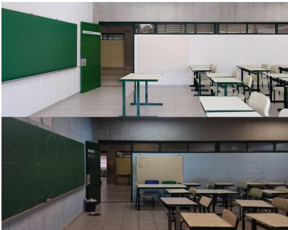
Imagem 3: Contraste das salas de aula antes e após a inauguração da escola. Nota-se a composição massiva de cinza-branco na primeira imagem, enquanto na segunda podemos observar o azul claro nas paredes.

Por meio de interações com professores, descobri que o projeto inicial para a instituição era a criação de uma Escola Técnica (ETEC), voltada para cursos de produção industrial. Isto justifica, em certa medida, a ausência de uma biblioteca capaz de suprir as necessidades da atual instituição (voltada para o ensino básico), a quantidade e tamanho das salas de aula, além da paleta de cores escolhida para o espaço.