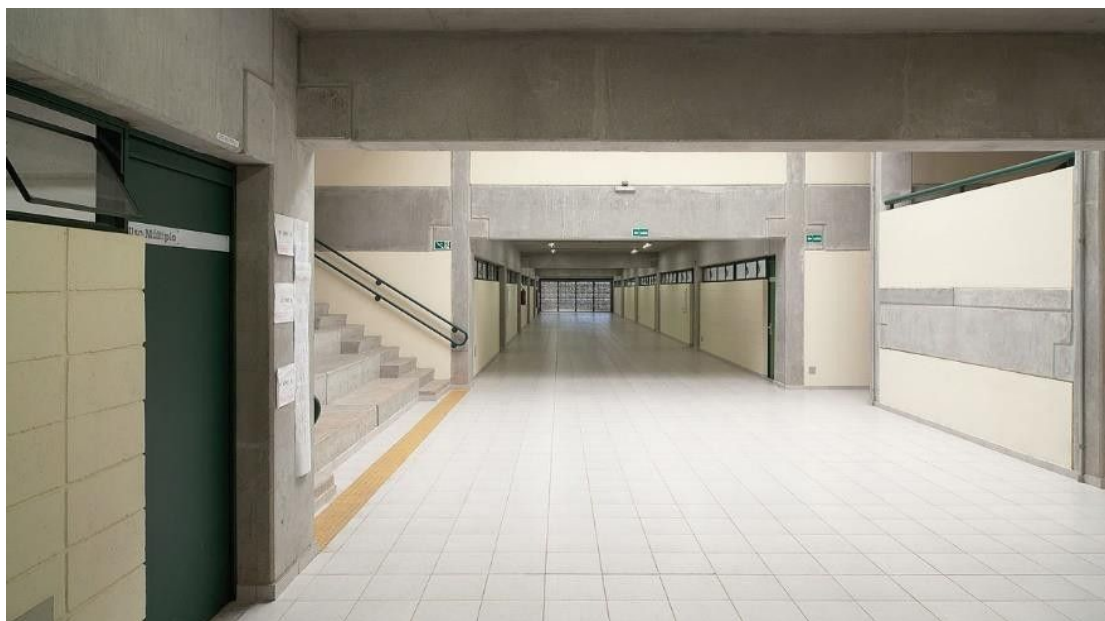
Imagem 7: O corredor central. Nele, é possível observar o uso de concreto bruto e ao fundo, a presença de um brise, elemento característico de obras brutalistas.

tamanho e uso social diferiam. (DEPAULE citado por SEGAUD, 2016, p. 105)