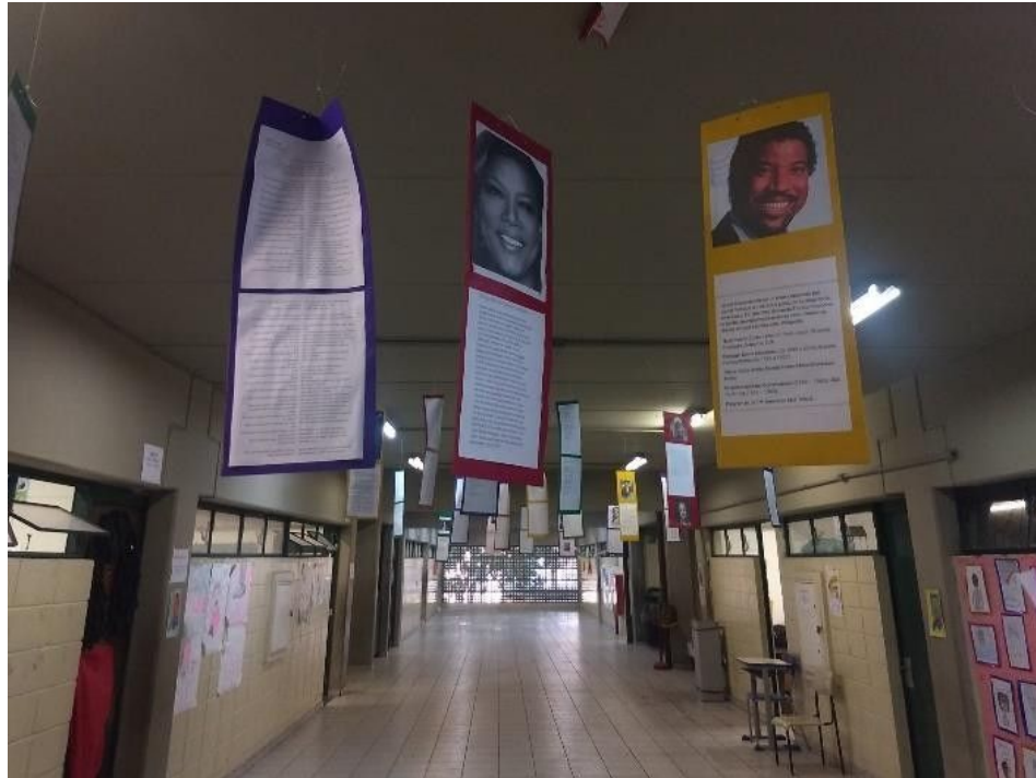
Imagem 9: Cartazes com imagens e uma pequena biografia de pessoas negras de grande importância para o desenvolvimento da humanidade. Além dos cartazes, podemos observar a sala da AOE no canto inferior esquerdo.

identidade tanto étnica quanto social. Ao proporem o programa temático dos trabalhos, os estudantes reivindicam sua identidade ao buscarem o diálogo sobre questões presentes em suas realidades, muitas vezes invisibilizadas em bases curriculares.