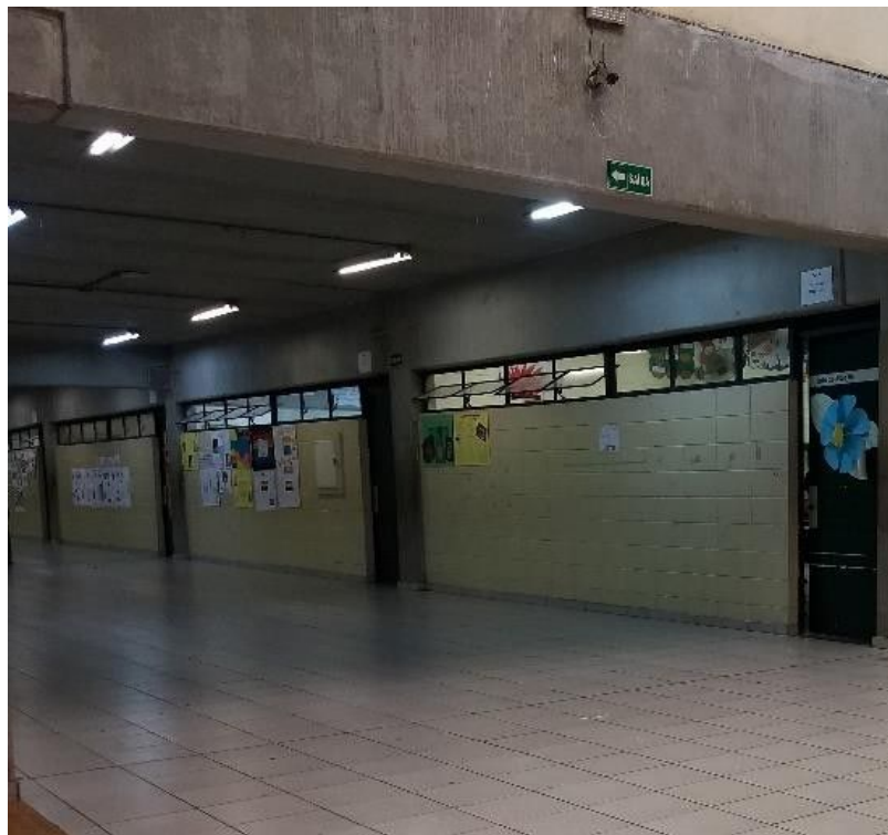
Imagem 12: O contraste entre a iluminação advinda do telhado translúcido com as luzes artificiais do corredor.

O teto que recobre o corredor, imediatamente em frente à arquibancada, é feito de um material translúcido, o que permite a incidência parcial de luz solar. Aliando este fato às percepções dos estudantes sobre o espaço mencionadas (frio, fechado etc.), podemos levantar hipóteses acerca da escolha dos estudantes por este espaço para socialização.