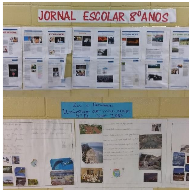
Imagem 10: Artigos jornalísticos, desenvolvidos num ênfase à conservação do meio ambiente.

Considerando o supracitado, pode-se propor que a manutenção do lugar antropológico é configurada de forma recíproca. Por parte dos professores, o desenvolvimento práticas pedagógicas e experiências que dialoguem com as especificidades do corpo discente, criando a sensação de pertencimento e acolhimento. Por parte dos alunos, a exposição de seus interesses àqueles que podem legitimá-los e reproduzi-los (docentes e gestores), desenvolvendo ativamente seu processo socioeducativo. Ao idealizarem um espaço no qual podem subjetivar-se, os estudantes demonstram interesse em habitar uma escola com os aspectos de um lugar antropológico e não apenas um lugar no qual passam algumas horas pela semana.