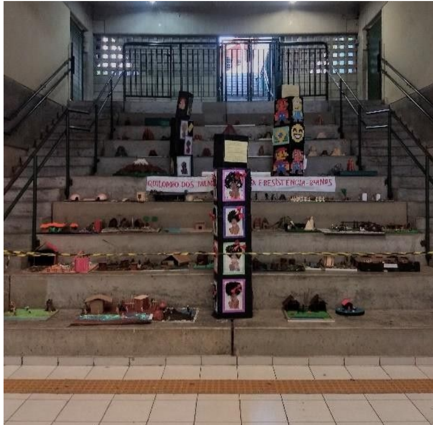
Imagem 14: A arquibancada sendo utilizada de suporte material para exposição de maquetes confeccionadas pelos estudantes sobre as lutas e resistência do Quilombo dos Palmares. Podemos observar uma faixa para condução de deficientes visuais em frente à arquibancada, o que expressa certa preocupação dos arquitetos com a acessibilidade.

Todos os métodos utilizados para ocupar o espaço foram pouco eficazes por não atingirem o núcleo do vazio: o meio do corredor, que, por ser largo demais para a quantidade de alunos, deixa brechas em seu uso, tornando-o, em certa medida, uma zona morta. Os estudantes tendem a ressignificar o conceito de “corredor” ao desejarem a inserção de elementos capazes de transformá-lo de um não-lugar em um lugar. Um espaço não só de passagem e pressão, mas de descontração e atividades diferenciadas: um espaço habitado. Todo itinerário é, de certo modo, desviado pelos nomes que lhe dão sentidos (ou direções) até aí imprevisíveis. Esses nomes criam o não-lugar nos lugares; eles os transformam em passagens (CERTEAU citado por AUGÉ, 2012). Por ser usado majoritariamente para o deslocamento, o nome do lugar (“corredor”, contido no signo “escola”) adquire um estatuto particular, transformando-se em um não-lugar inserido em um lugar. Segundo Augé (2012), o conceito de não-lugar designa duas realidades distintas e complementares: espaços constituídos em relação a certos fins (como transporte, trânsito, comércio, lazer etc.) e a relação que os indivíduos