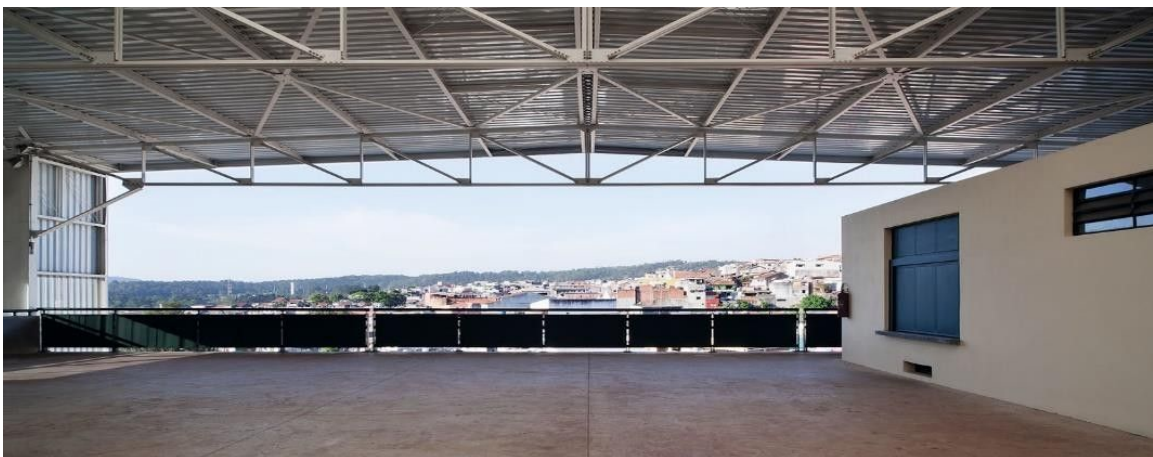
Imagem 5: Trecho vazado que permite vista para o Parque Anhanguera.

Apesar de não existirem relógios, elementos tão vulgares do poder disciplinar, espalhados pela escola, pode observar em diálogos com estudantes e docentes que alguns aspectos estruturais da edificação demonstram o caráter disciplinar da instituição. O uso de cinza, a incidência massiva de iluminação artificial branca e a presença de grades em diversos ambientes da escola tornam o espaço repressor. Um estudante do 7 o ano, quando solicitado para descrever sua percepção do prédio, respondeu-me que este “parece a FEBEM [antiga Fundação Estadual para o Bem Estar do Menor]”. Alguns termos gerais que nortearam o discurso sobre o ambiente foram: carcerário, cansativo, fechado, frio, limitante, militarista etc. Segundo Augé (2012), o peso das palavras não é somente dos nomes próprios. Muitos substantivos possuem, em certos contextos, a mesma força de evocação. Todos os termos utilizados para descrição do espaço evocaram a ideia de uma microfísica do poder, posta em jogo pelos aparelhos e instituições.