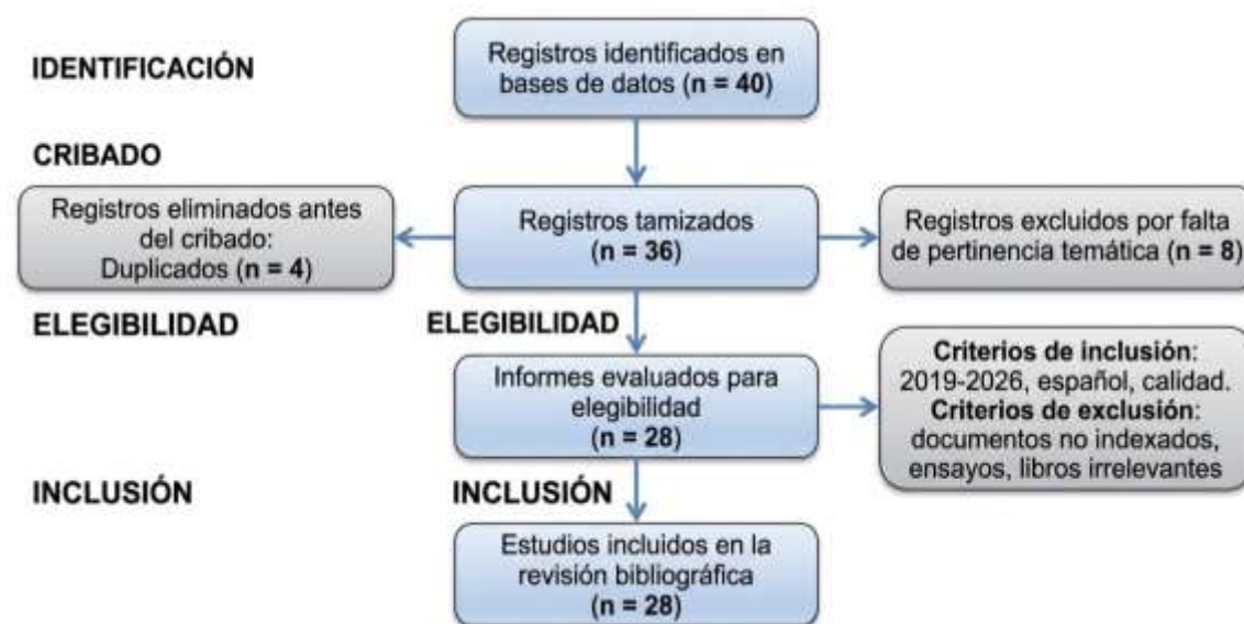
Figura 1: Diagrama PRISMA