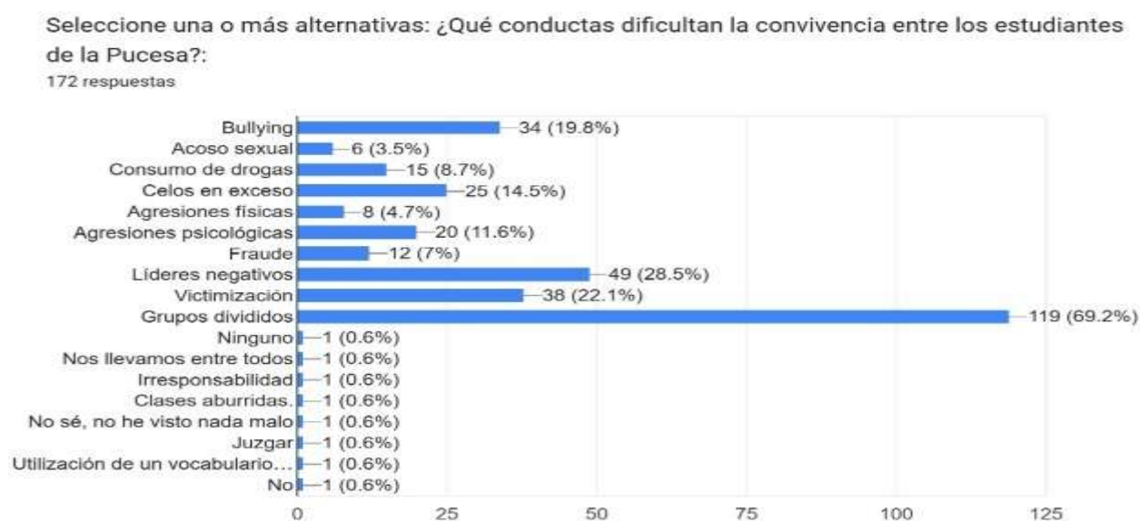
Figura 4: Conductas que dificultan la convivencia universitaria

Se concuerda con Sandoval et al. (2014) en que las familias actuales enfrentan desafíos económicos que obligan a los padres ausentarse del hogar por tiempos prolongados y limitar la calidad de vida.