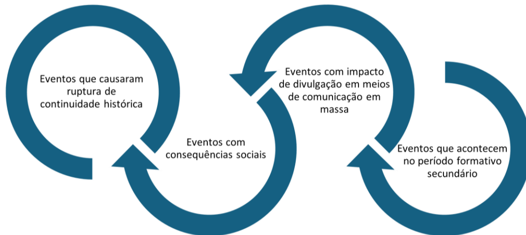
Figura 1 Características de eventos com potencial formador de gerações