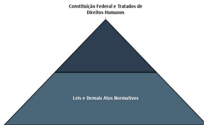
Figura 4 - Hierarquia constitucional dos tratados de direitos humanos

[...] nunca é demais lembrar que a tese da paridade entre a Constituição e os tratados de direitos humanos é anterior à EC nº 45 e encontra sustentação já no teor do §2º do mesmo artigo, que, na sua condição de norma inclusiva, consagrando a abertura material do catálogo constitucional de direitos fundamentais, já vinha sendo interpretado como recepcionando os direitos humanos oriundos de textos internacionais na condição de materialmente constitucionais. De resto, há que enfatizar sempre que a condição de direitos fundamentais é absolutamente incompatível com uma hierarquia normativa infraconstitucional, visto que direitos fundamentais são sempre direitos constitucionais e não podem estar à disposição plena do legislador ordinário (SARLET, 2008, p. 100).