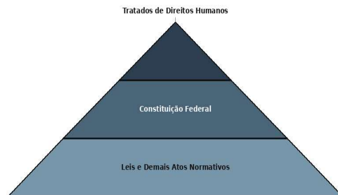
Figura 2 - Hierarquia supraconstitucional dos tratados de direitos humanos

A Constituição de 1988 no §2º do art. 5º constitucionalizou as normas de direitos humanos consagradas nos tratados. Significando isto que as referidas normas são normas constitucionais, como diz Flávia Piovesan. Contudo sou ainda mais radical no sentido de que a norma internacional prevalece sobre a norma constitucional, mesmo naquele caso em que uma norma constitucional posterior tente revogar uma norma internacional constitucionalizada (MELLO, 2001, p. 25).