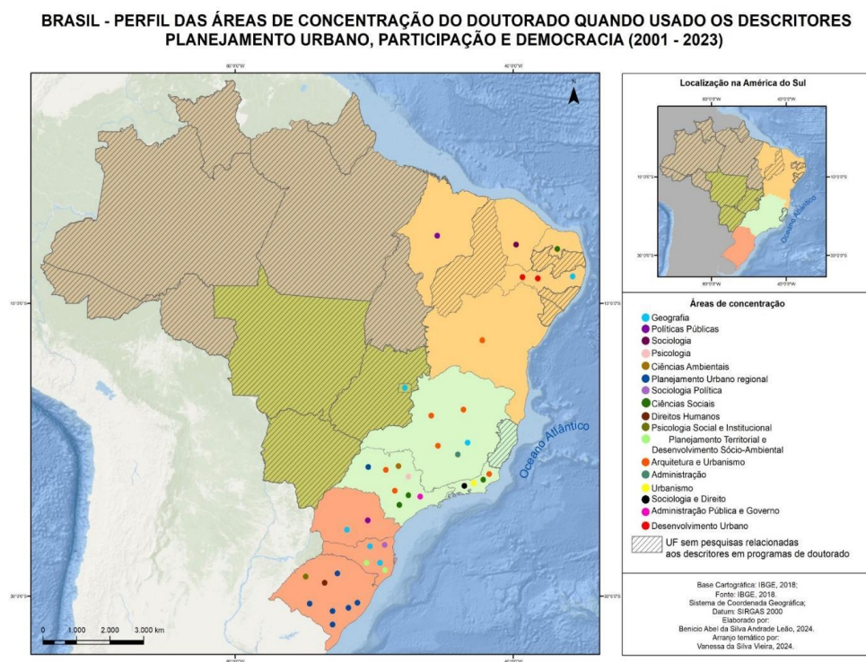
Figura 4 – Perfil das áreas de concentração do doutorado por IES e UF

A Figura 4 evidencia disparidades regionais acentuadas nas pesquisas doutorais que versam sobre a temática do planejamento urbano participativo. Destacam-se a região Sul e Sudeste, e dentro desse recorte o Rio Grande do Sul se sobressai. Por outro lado, observa-se o enorme vazio regional, entre o Norte e Centro-oeste e baixa representatividade no Nordeste.