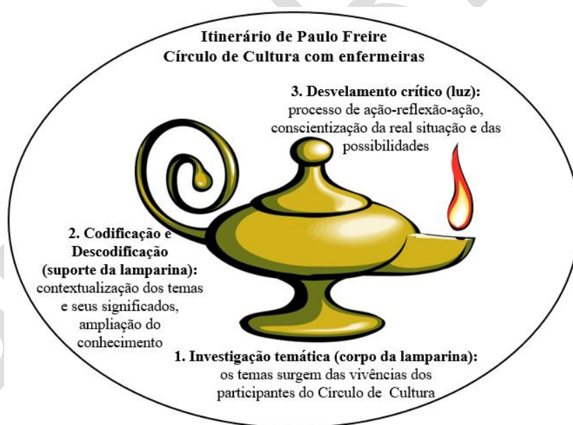
Figura 1- Itinerário de Paulo Freire: Analogia com a lamparina