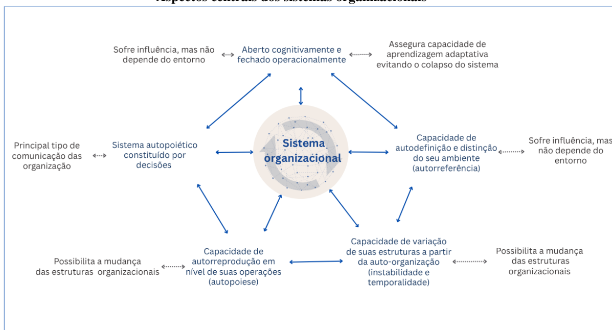
Figura 2 Aspectos centrais dos sistemas organizacionais

Pensar organizações como sistemas traz significativa contribuição para as teorias organizacionais, permitindo compreender as organizações por meio da sua capacidade de reduzir a complexidade (por sua seleção e contingência) e se auto-organizar a partir da tomada de decisão, que configura sua operação fundamental e embasa seu código próprio. No âmbito organizacional, compreender a tomada de decisões, a partir das premissas da complexidade, seletividade e contingência, contribui para uma análise mais adequada do funcionamento das organizações (Figura 2).