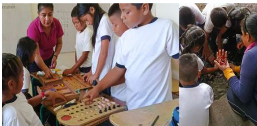
Figura 3: Actividades de clase durante la sub-fase de problematización

Según Alquina-Chango (2020), el uso de la taptana en la enseñanza de las operaciones aritméticas básicas en estudiantes del cuarto grado de Educación Básica constituye un recurso didáctico efectivo que mejora la capacidad para resolver operaciones de sumas y restas, así como la comprensión del sistema decimal.