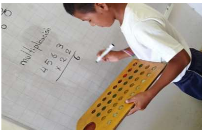
Figura 4: Resolución de operaciones aritméticas empleando la taptana

Estas observaciones registradas están en línea con lo expuesto por Cabrera & Bojorque (2024), quienes sostienen que la manipulación de la taptana juntamente con semillas de diferentes colores y formas facilita el aprendizaje de las operaciones aritméticas básicas, al permitir que los estudiantes transiten del conocimiento concreto al abstracto. Además, “el uso de la taptana dentro del aula es constructivo para las profesoras y sus alumnos; ambos se enriquecieron con el conocimiento y la atractiva forma de trabajar con este recurso didáctico” (Luna et al., 2019, p. 18).