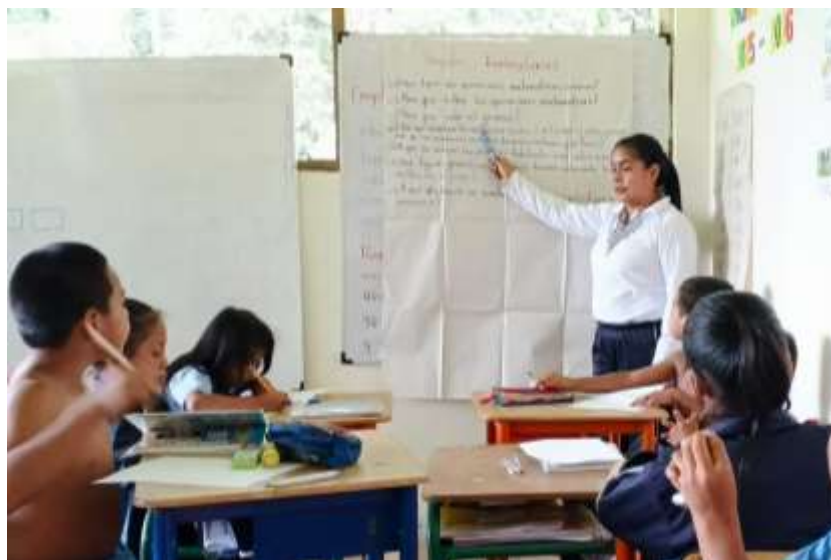
Figura 2: Actividades de clase durante la sub-fase sensorio perceptiva

En la sub-fase de problematización, los estudiantes respondieron preguntas exploratorias que activaron sus conocimientos relacionados con las operaciones aritméticas básicas y las unidades de medida. Esto promovió su reflexión sobre los productos nutritivos de la Amazonía y algunas relaciones con las operaciones matemáticas, fortaleciendo la conexión entre prácticas y saberes ancestrales y la enseñanza formal.