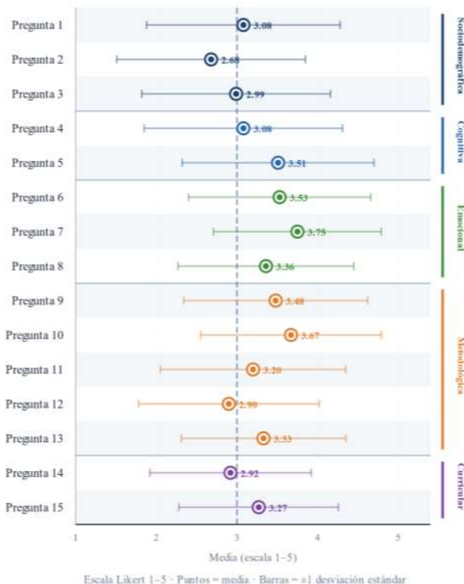
Figura 1: Media e intervalo de dispersión ( \pm 1 DE) por ítem

La figura 1 además de presentar de forma detallada los quince ítems que componen las cinco dimensiones indagadas en el instrumento, complementa el análisis mediante un gráfico de puntos con intervalos de dispersión que permiten identificar a los ítems que presentan mayor variabilidad interna. Los puntos representan las medias de cada ítem, las barras corresponden a \pm 1 desviación estándar, el color de cada ítem indica la dimensión a la que pertenece; y, la línea punteada vertical señala el punto neutro de la escala ( M = 3.0 ). Esta figura por ítem permite definir por ejemplo que el ítem que los participantes consideran con mayor incidencia para el rendimiento es el estado emocional del estudiante (3.75) y el que selecciona como el de menor incidencia el lugar de procedencia (2.68).