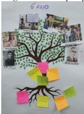
Fotografia 1 – Bosque Ipê

Para o grupo Araucária, escritores de livros, pessoas famosas, adolescentes, adultos, alunos, professores, robôs ou IA (Inteligência Artificial) e crianças podem ser autores. Ficam de fora do universo da autoria outros seres vivos e seres inanimados. Notamos a ampliação de variáveis, pelo quantitativo de post-it e fotografias na produção da árvore da autoria, quando relacionamos o Bosque Ipê (Fotografia 1) com o Bosque Araucária (Fotografia 2).