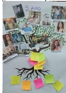
Fotografia 2 – Bosque Araucária