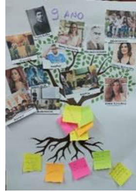
Fotografia 2 – Bosque Araucária