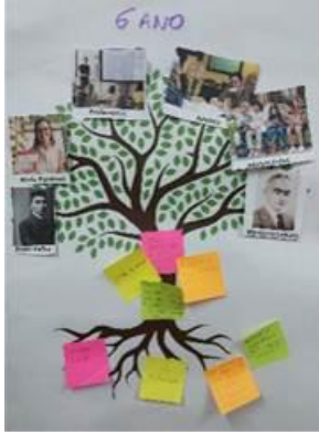
Fotografia 1 – Bosque Ipê