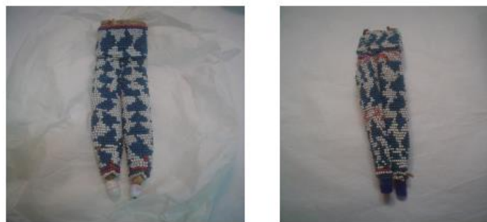
Fig. 14 – Miluína (nº inv. 893)

Figura 1: Fotografias da miluína presentes na dissertação de Lia Jorge.