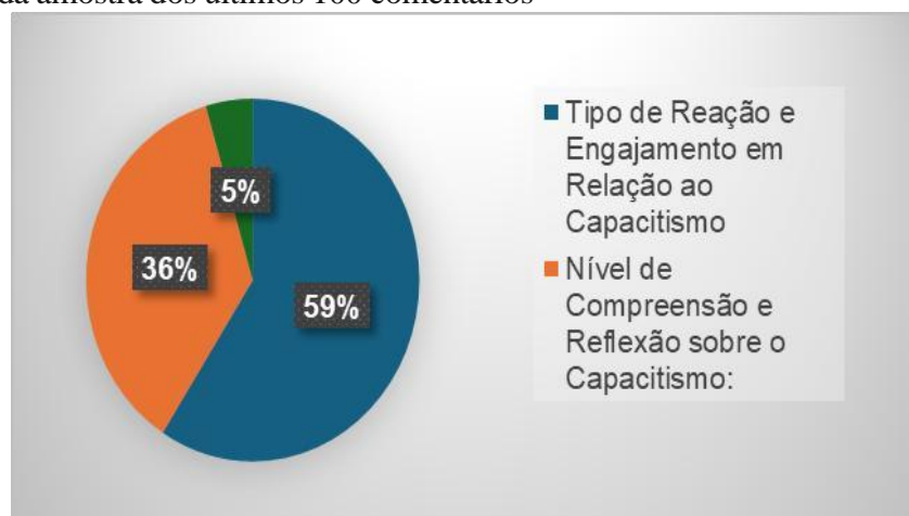
Figura 2: Gráfico geral da amostra dos últimos 100 comentários