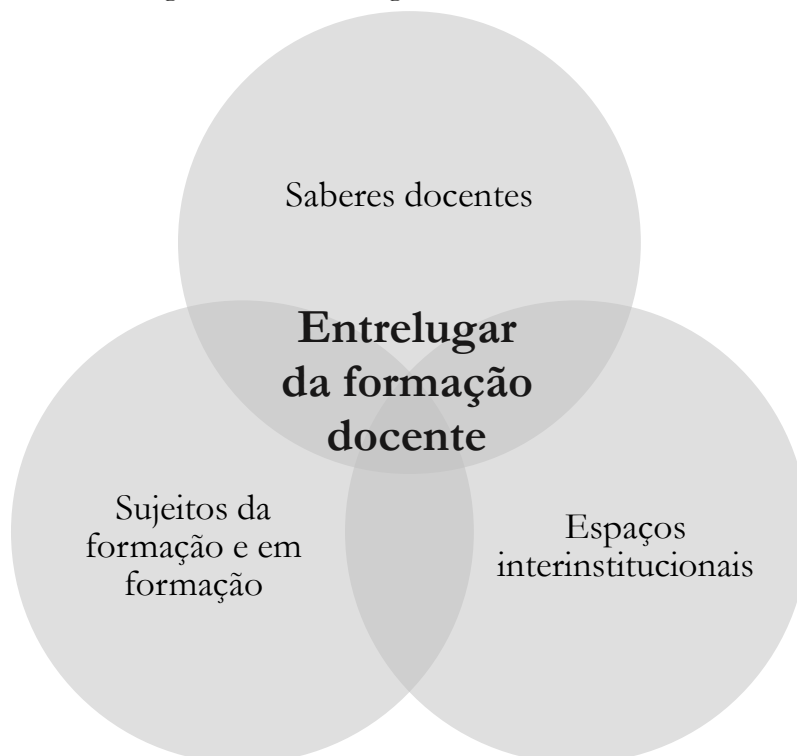
Diagrama 2 – Entrelugar da formação docente