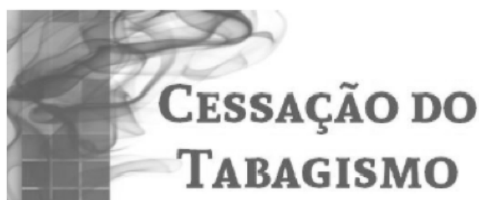
Figura 1 – Layout da apresentação inicial do curso no Moodle®