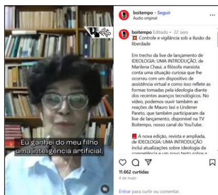
FIGURA 1: O panóptico virtual

Durante uma live 6 de lançamento do seu livro Ideologia: uma introdução , Marilena Chauí relatou um episódio inusitado envolvendo uma IA. Registrada em um vídeo posteriormente recortado e divulgado pela Editora Boitempo – conforme a Figura 1: a Amostra 1 – a cena compõe um dos nossos corpora . No momento em que o enunciador discorria sobre os mecanismos de controle e vigilância que operam sob a aparência de liberdade, utilizou a sua experiência com esse tipo de tecnologia(s) de informação e comunicação móvel sem fio (TICMS) para mostrar como ocorre a manifestação e (re)configuração da ideologia frente à tecnologia.