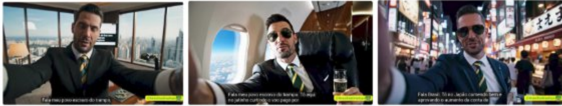
Quadro 1: Prints do vídeo Conta de luz cara? Agradeça aos empresários!

ALT: Sequência de três capturas de tela geradas por IA apresentando o personagem satírico Hugo em cenários de ostentação, como o interior de um jatinho e uma viagem ao Japão. As imagens ilustram a representação de um corpo político que ironiza o aumento da conta de energia enquanto desfruta de privilégios.