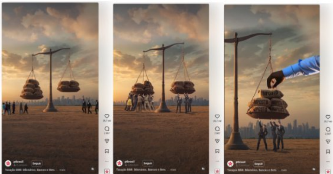
Quadro 3: Prints do vídeo da campanha “Taxação BBB”.

ALT: Três ilustrações produzidas por IA que utilizam a metáfora de uma balança de justiça fiscal desequilibrada entre o povo e empresários. Uma mão negra intervém para retirar o peso dos impostos do lado do povo e transferi-lo para a balança dos empresários, simbolizando o equilíbrio fiscal.