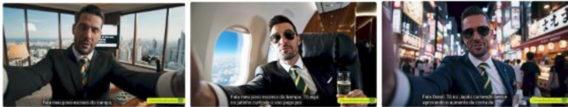
Quadro 1: Prints do vídeo Conta de luz cara? Agradeça aos empresários!

ALT: Sequência de três capturas de tela geradas por IA apresentando o personagem satírico Hugo em cenários de ostentação, como o interior de um jatinho e uma viagem ao Japão. As imagens ilustram a representação de um corpo político que ironiza o aumento da conta de energia enquanto desfruta de privilégios.