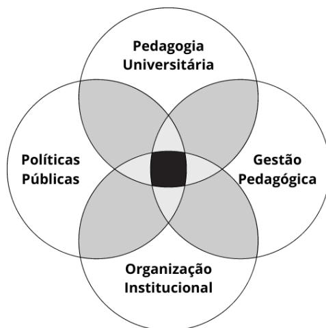
Figura 1 - Intersecções entre os conceitos