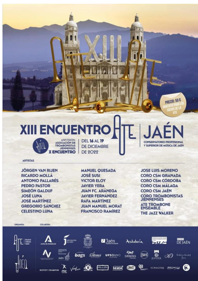
Imagen 1– Cartel promocional del XIII Encuentro ATE ( https://trombonistas.net/?page_id=109 )