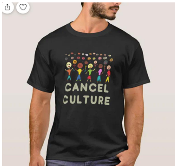
Imagem 1: Camiseta com a estampa “Cancel Culture” à venda na internet. Disponível em: https://www.zazzle.com.br/camiseta_cancelar_cultura235912618008414048 Acesso em: 12/03/2024

Por fim, o eixo da circulação, está, no meu entendimento, mais próximo do sujeito, pois refere-se justamente aos diferentes modos como os discursos se movimentam de um objeto simbólico a outro. São os trajetos que cada dizer toma, seguindo um percurso, historicizando-se de uma maneira e não de outra. Os efeitos dessa circulação afetam os sujeitos na sua relação com os sentidos, pois igualmente aos outros dois momentos, dissimula-se em evidências. Proponho um pequeno exemplo: