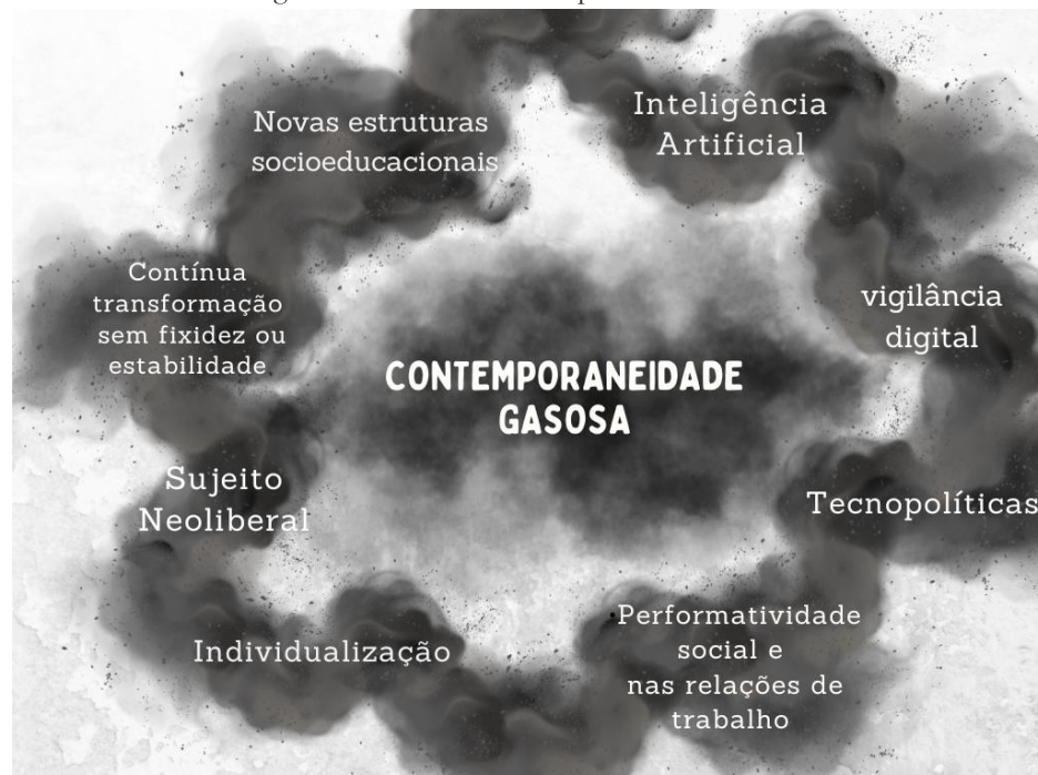
Figura 8 - Matriz de Contemporaneidade Gasosa

Fonte: MELLO, Gabriela Barichello. Contemporaneidade gasosa: efeitos das mídias sociais na formação discursiva da educação superior em contextos emergentes . 2025. Tese (Doutorado em Educação) – Programa de Pós-Graduação em Educação, Universidade Federal de Santa Maria, Santa Maria, 2025.