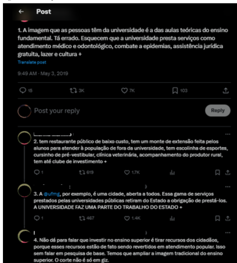
Figura 5 - Exemplo de discurso inclusivo sobre extensão nas universidades no X