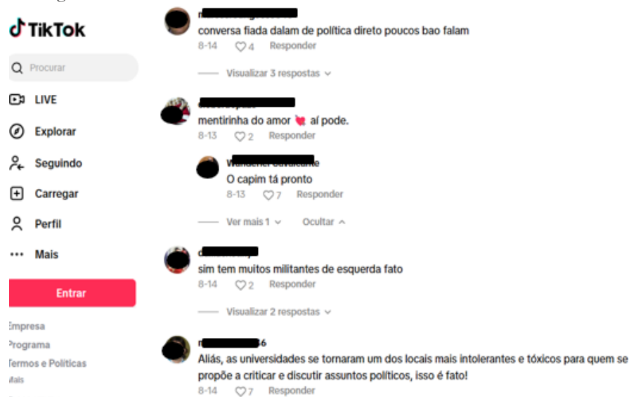
Figura 3 - Comentários ao vídeo “Cinco mitos sobre as universidades federais”