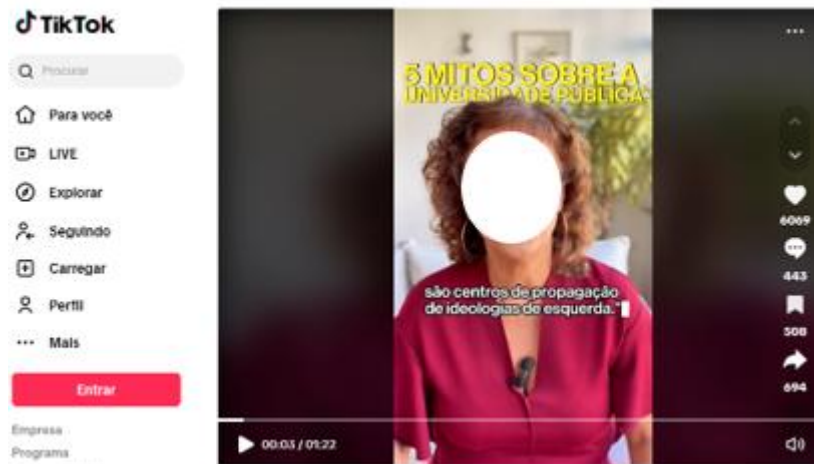
Figura 2 - Vídeo no tiktok dos 5 mitos sobre as Universidades Federais