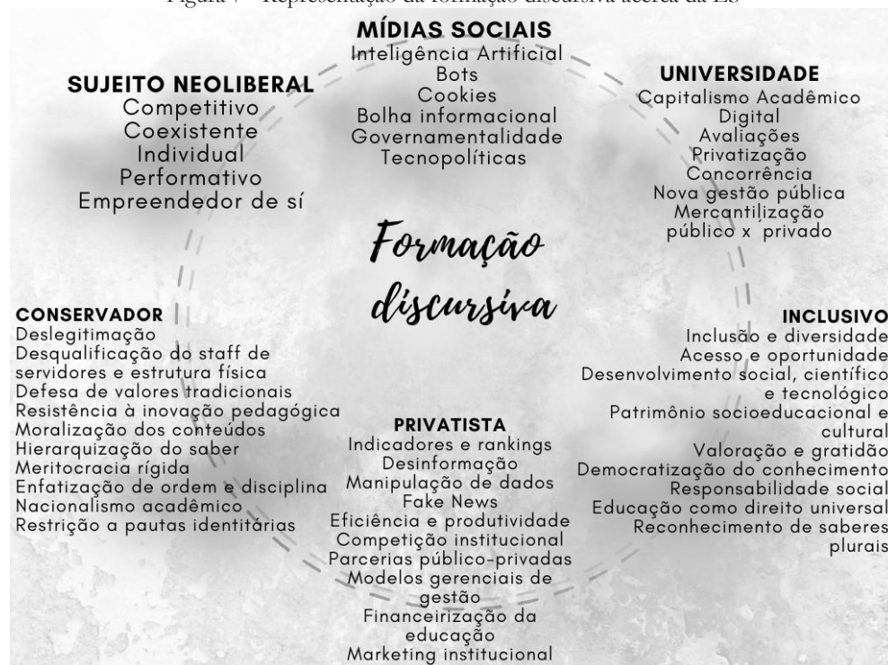
Figura 7 - Representação da formação discursiva acerca da ES

A Figura 7 apresenta uma síntese visual desta formação discursiva e dos efeitos simbólicos identificados, evidenciando como a “gasosidade” informacional impacta a imagem e a legitimidade das universidades públicas na era da IA.