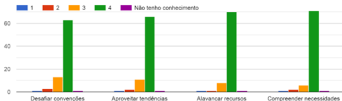
Figura 3: Importância dos padrões de pensamento para as propostas inovadoras de IaH

Já em termos de importância atribuída a cada um dos padrões de pensamento, conforme se pode observar na Figura 3, os respondentes apontam para ‘compreender necessidades’ como o mais importante (71 respostas nível 4), seguido de ‘alavancar recursos’ (70 respostas nível 4), ‘aproveitar tendências’ (66 respostas nível 4) e ‘desafiar convenções’ (63 respostas nível 4).