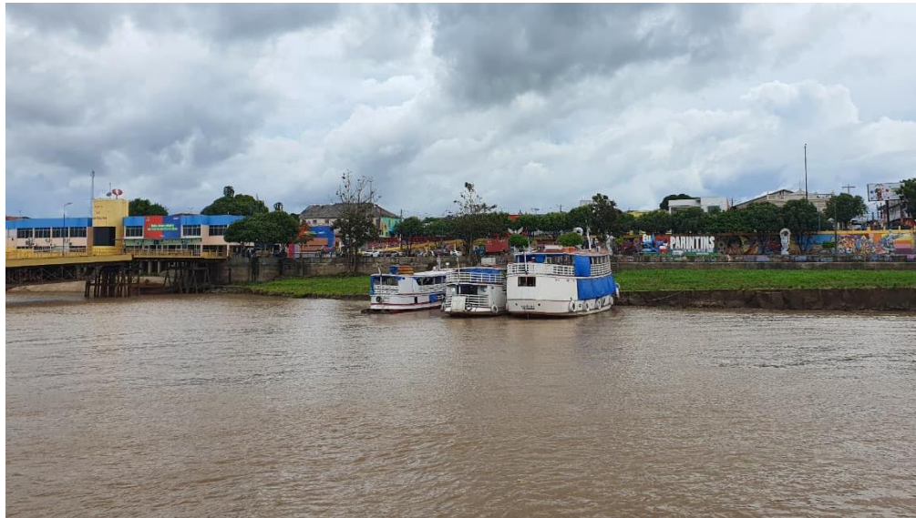
Figura 1 – Orla de Parintins (AM), no Rio Amazonas

municípios. A sazonalidade dos rios, com períodos de cheia e seca, impacta a navegabilidade e exige planejamento estratégico para garantir o abastecimento e a logística na região.