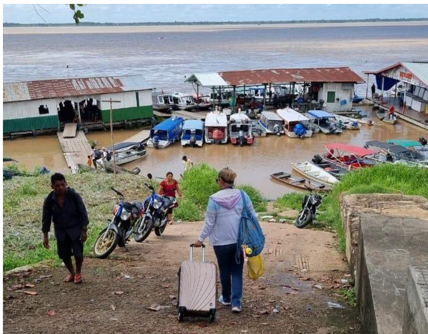
Figura 3 – Porto de Manacapuru (AM), no Rio Solimões

Em suma, a tese atingiu seus objetivos, visto que apresenta importante contribuição para os registros histórico, cultural e linguístico, além de caracteriza-se como inédita na região.