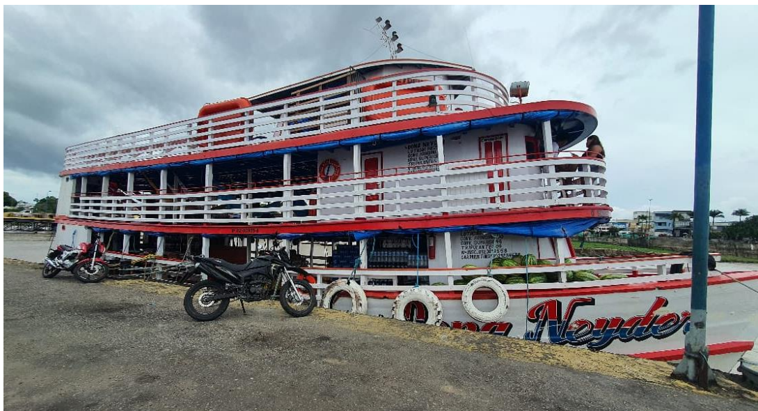
Figura 4 – Barco que faz o trajeto Parintins-Maués-Parintins

fluvial entre os municípios. No entanto, durante a estiagem, a navegação ocorre de forma mais lenta, tanto por conta do nível de água dos rios que baixa consideravelmente, o que impossibilita o acesso pelos furos, que desaparecem, obrigando os barcos a seguirem o fluxo natural e as curvas dos rios, quanto pelos perigos causados pela vazante, como a formação de bancos de areia no meio curso d'água. Não há transporte rodoviário intermunicipal na microrregião investigada, assim como na maioria dos municípios do Amazonas.