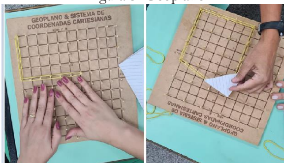
Figura 3: Geoplano

Bárbara sugeriu que o material não tenha todos os pregos, pelo que o formador indicou que o grupo pensasse em espaçá-los mais. No encontro posterior, o formador levou o geoplano com pinos de madeira removíveis, o que facilitou o processo de análise do material, conforme ilustrado pela Figura 3.