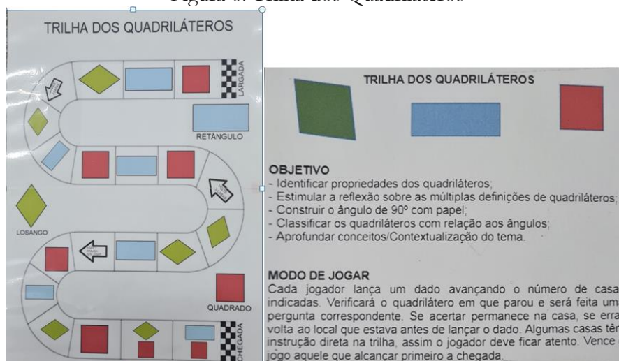
Figura 6: Trilha dos Quadriláteros