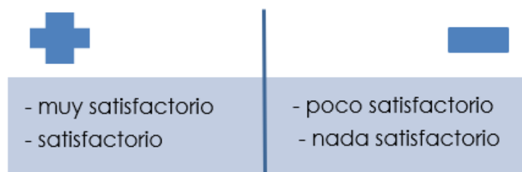
Figura 1: Agrupación de criterios de evaluación

Para generar un análisis sobre experiencias positivas y negativas se unifican los criterios de evaluación (figura 1), sumados a los porcentajes de los criterios “muy satisfactorio” y “satisfactorio”; por otro lado, para reconocer los valores negativos se suma el “poco satisfactorio”, con el “nada satisfactorio”, en función de analizar y reconocer en cuál periodo aumentaron o disminuyeron las buenas o malas experiencias en la práctica de estos estudiantes.