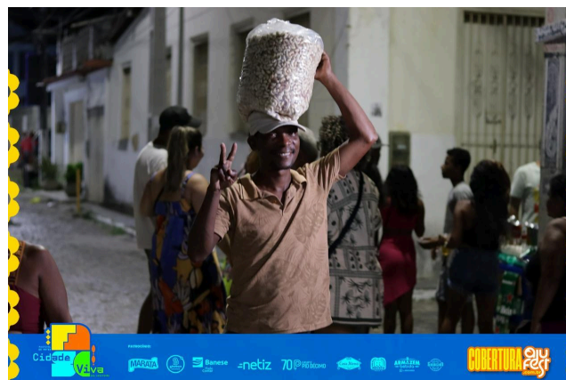
Figura 3: Vendedor ambulante no Festival de Artes de São Cristóvão/SE