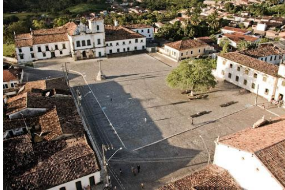
Figura 1: Vista aérea da Praça São Francisco em São Cristóvão