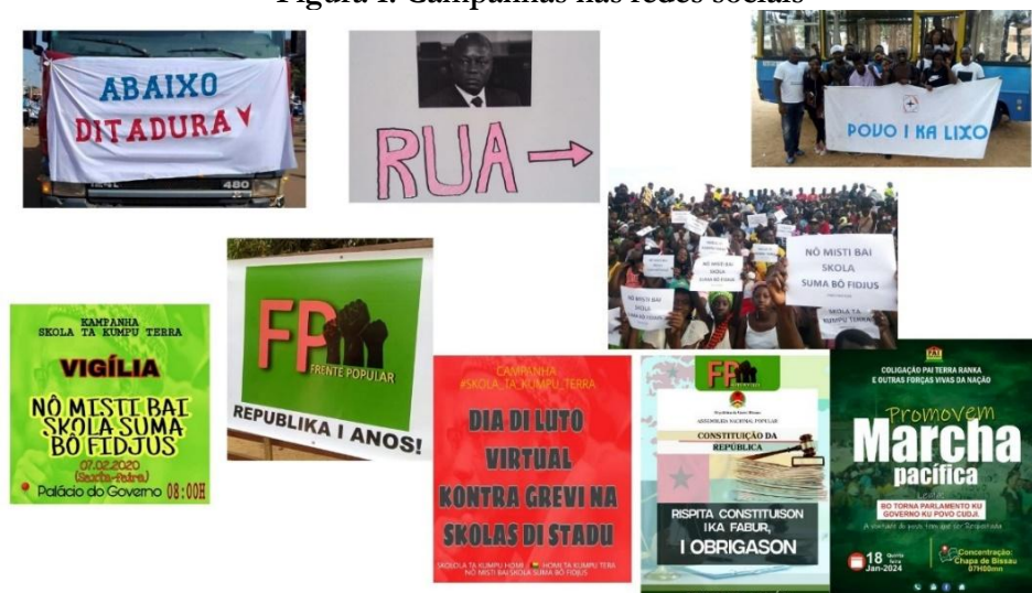
Figura 1: Campanhas nas redes sociais

A seguir, apresenta-se figura de algumas campanhas realizadas pelos movimentos nas redes, com destaque para o Facebook e o Instagram. Cabe ressaltar, contudo, a crescente relevância do TikTok, cuja ascensão tem ampliado significativamente o alcance e a visibilidade dessas iniciativas, sendo usado pelos ativistas, principalmente para divulgar vídeos.