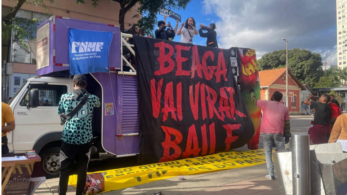
Figura 3. Ato BH VAI VIRAR BAILE, Praça da Estação, Belo Horizonte, 2025. Autoria: Steffane Santos