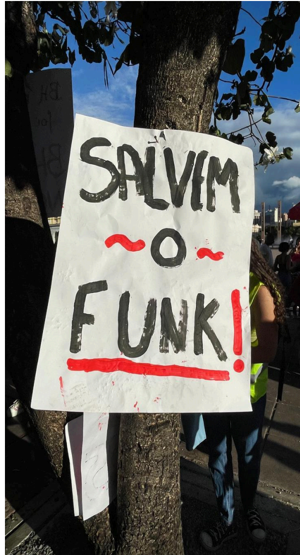
Figura 1 e 2. Ato BH VAI VIRAR BAILE, Praça da Estação, Belo Horizonte, 2025. Autoria: Steffane Santos