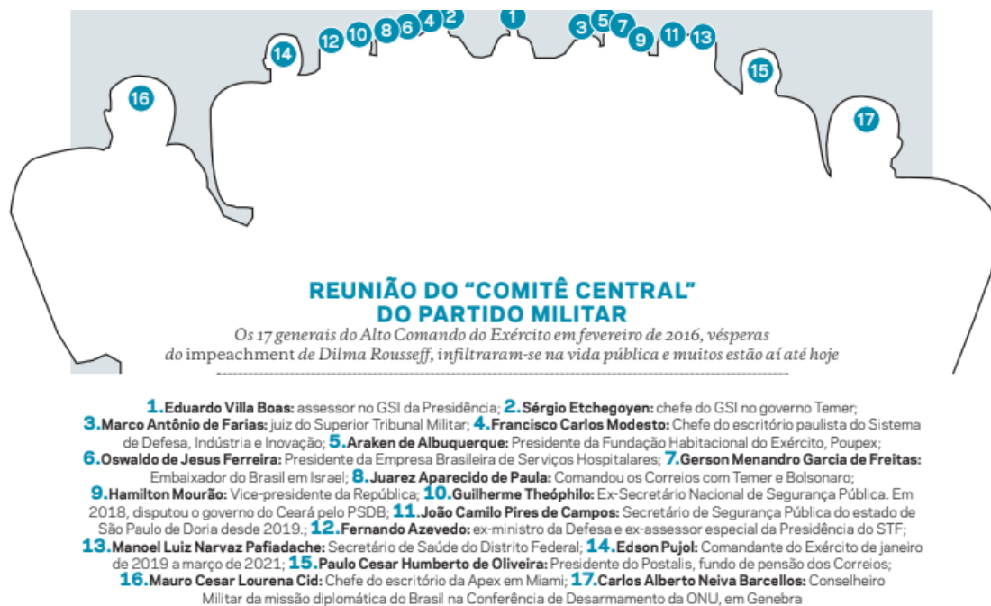
Figura 2 - Identificação dos 17 generais e cargos ocupados até 2021