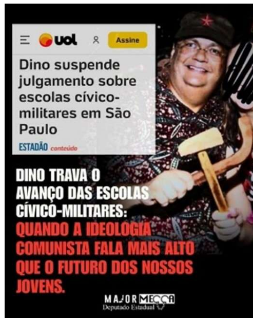
Publicação no Facebook, autor: Deputado Estadual Major Mecca (SP-PL).

A publicação de 5 de maio de 2025, realizada pelo perfil pessoal do deputado estadual Major Mecca, combina texto e imagem para defender as escolas cívico-militares e atacar o Supremo Tribunal Federal. Com mais de 1 mil curtidas e 1 mil compartilhamentos, a postagem acompanha o seguinte texto: