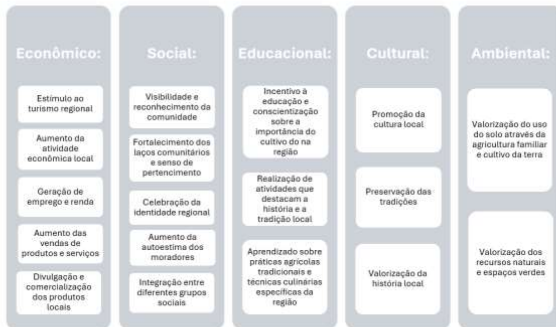
Figura 2: Benefícios da Festa do Aipim.

mais que os pontos positivos sobressaiam com muita facilidade os negativos, vale ressaltar que há pontos de melhorias, na questão de estrutura e acessibilidade para chegar no local da festa. Em relação aos benefícios proporcionados pela Festa do Aipim para a região, eles foram categorizados nos eixos delineados na figura 2, facilitando a visualização e compreensão de como o evento contribui de maneira abrangente para o desenvolvimento e bem-estar da comunidade em diversos aspectos da vida econômica, social, educacional, cultural e ambiental.