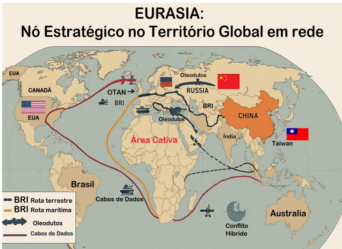
Figura 1 – EURASIA

Nesse contexto, o território não desaparece – ao contrário, torna-se cada vez mais estratégico. Contudo, sua centralidade se dá por meio de uma lógica seletiva: apenas certos pontos, certos “nós” passam a compor os circuitos dominantes do sistema técnico-científico-informacional global. É o que Milton Santos (1996) denominou de sistema reticulado , uma configuração marcada pela fluidez seletiva, pela centralização dos fluxos e pela subordinação dos lugares à lógica dos comandos. Um exemplo seria a reestruturação territorial da Eurásia em um nó estratégico.