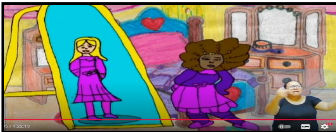
Figura 1 – Enquadramento Afrofabulação