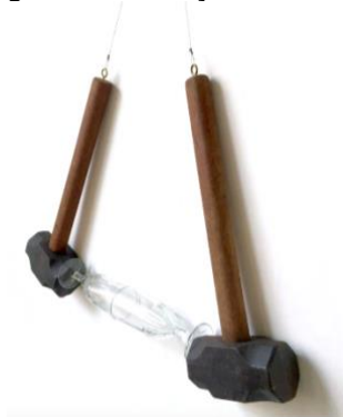
Figura 5: Instalação sem título