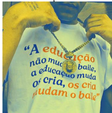
Figura 4: A educação não muda o baile

Fonte: @funkeirosculpt , publicado via Instagram em 6 de fev. de 2025 5