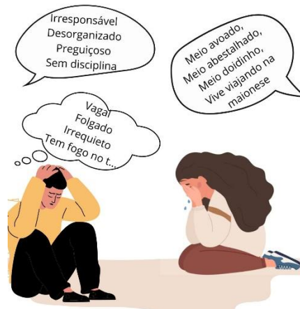
Figura III: Adjetivos e termos pejorativos que desumanizam pessoas com TDAH

A estigmatização de pessoas com TDAH também se expressa por meio de adjetivos pejorativos que reduzem a condição a traços de personalidade negativos. Muitos rótulos usados desconsideram a complexidade do transtorno e contribuem para a perpetuação do capacitismo velado, especialmente em ambientes como o ensino superior e o trabalho, onde essas palavras são frequentemente naturalizadas. A Figura III a seguir apresenta uma síntese visual dos termos mais comuns usados para desqualificar pessoas com TDAH.