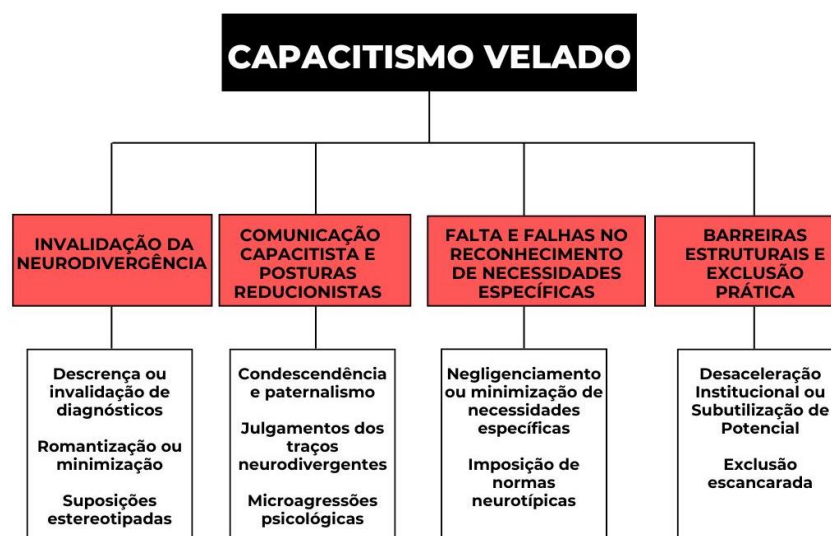
Figura IV: Modelo Conceitual de Capacitismo Velado

Com base no levantamento bibliográfico sobre as deficiências psicossociais, estigmas e estereótipos relacionados ao TEA e o TDAH, foram identificados diversos elementos que, quando aplicados na prática, operam como práticas de renovação do capacitismo, que são formas oficialmente não reconhecidas, porém impactantes, de capacitismo. Esses elementos, muitas vezes naturalizados no cotidiano institucional, não se apresentam como hostis em sua superfície, mas produzem inclusões excludentes, desvalorização e exigências de conformidade neurotípica que violam o direito à singularidade. Com o objetivo de apresentar como esse tipo de capacitismo pode se manifestar, a análise feita possibilitou a construção do “Modelo Conceitual de Capacitismo Velado”, que organiza tais manifestações em quatro categorias compostas por dez subcategorias apresentadas na Figura IV abaixo.