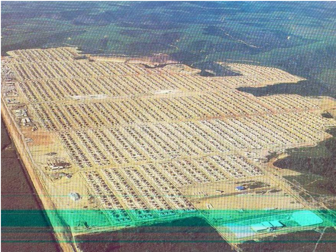
Figura 2 - Vista aérea do conjunto habitacional Benedito Bentes