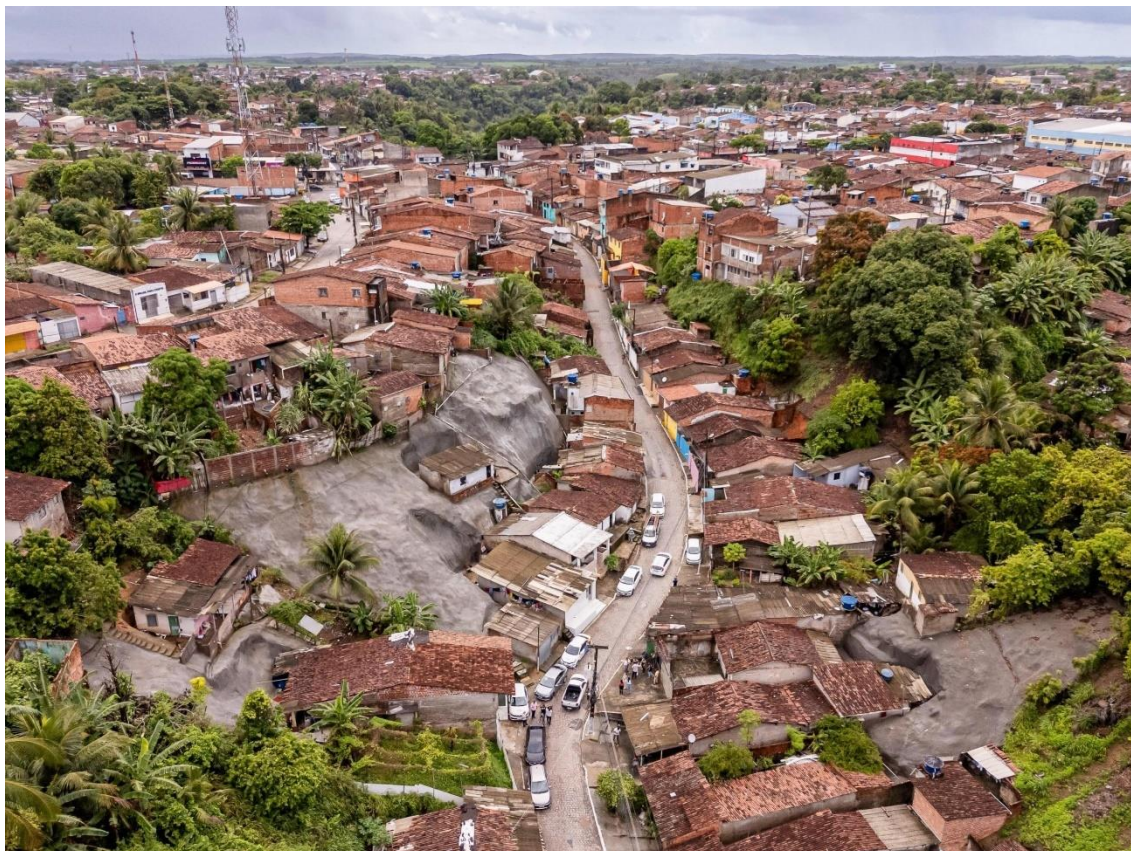
Figura 3 - Vista aérea da grota da alegria, Benedito Bentes

ocupados à revelia de qualquer lógica urbanística. No bairro de Benedito Bentes, isso se traduziu na proliferação de loteamentos clandestinos e no crescimento das grotas, edificações precárias erigidas em encostas e vales, que abrigavam a população em situação de extrema pobreza.