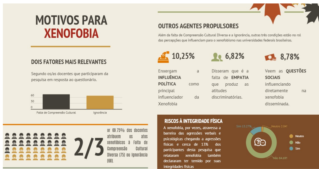
Figura 2 - Fatores e agentes influenciadores para xenofobia.