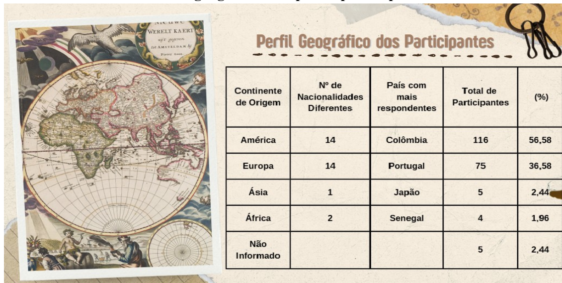
Tabela 1 - Perfil geográfico dos participantes por continente.