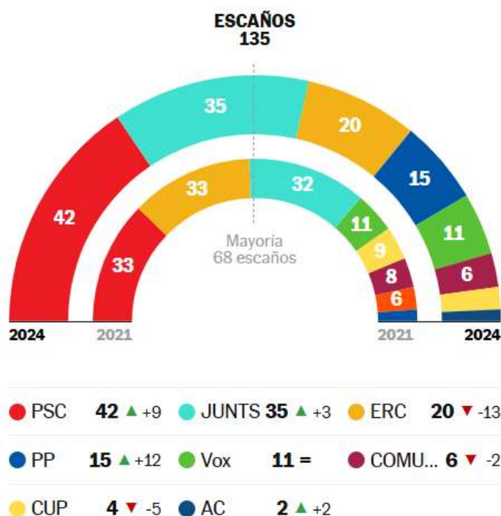
Figura 1: Elecciones autonómicas de Cataluña de 2024