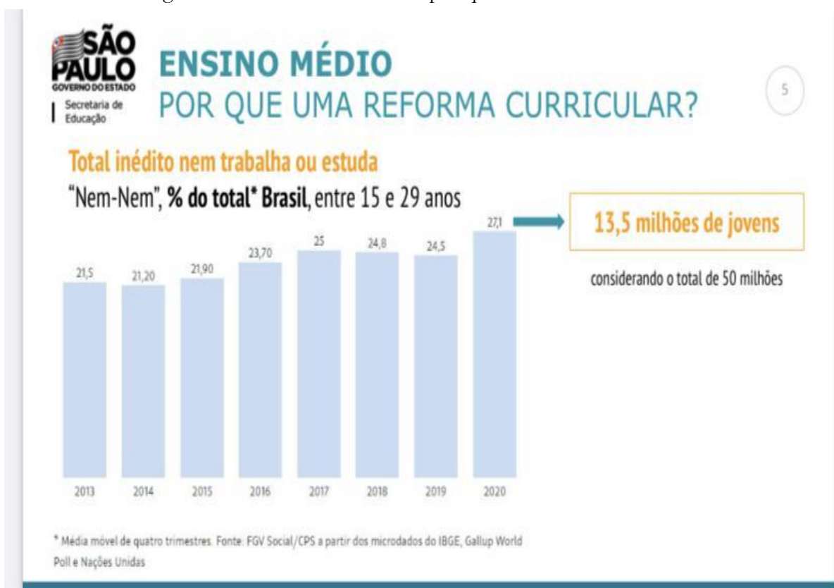
Figura 8 - Slide 5: Ensino Médio por que uma reforma curricular?