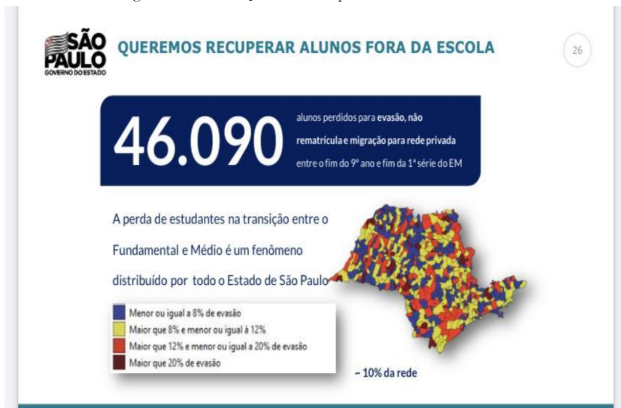
Figura 5 - Slide 26: Queremos recuperar alunos fora da escola.