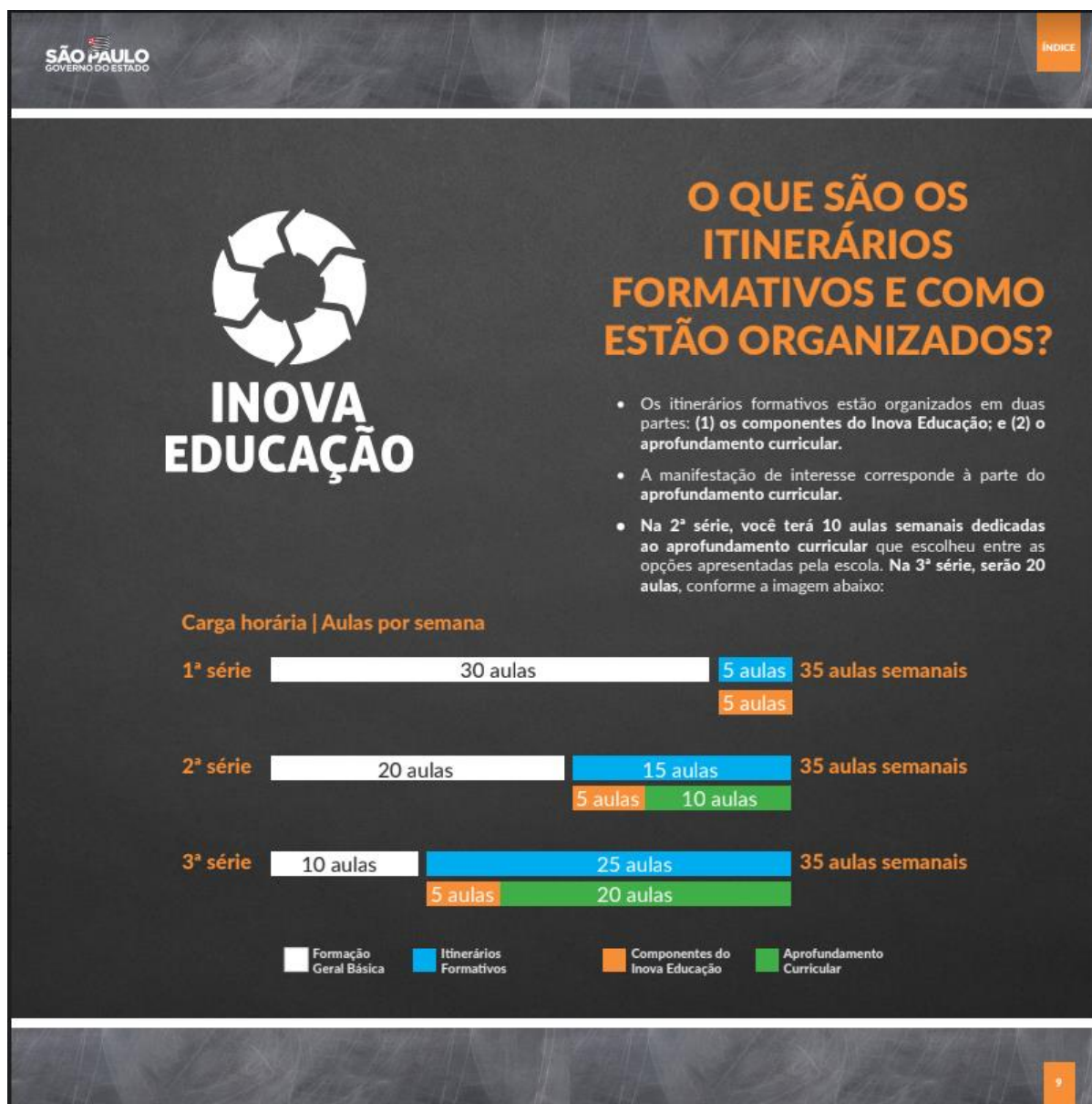
Figura 1 - Organização da carga horária e itinerários formativos