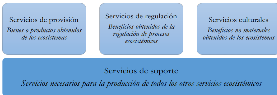
Figura 1. Clasificación de los servicios ecosistémicos de acuerdo con la Evaluación de Ecosistemas del Milenio (MEA, 2005)

En las últimas décadas, el Pago por Servicios Ambientales (PSA) ha surgido como una estrategia eficaz para incentivar la conservación y gestión sostenible de los recursos naturales, especialmente los recursos hídricos, en diversas regiones del mundo. En el contexto de Latinoamérica, donde la presión sobre los ecosistemas acuáticos y los efectos del cambio climático son cada vez más evidentes, se vuelve crucial entender el papel que juegan estos esquemas de PSA. En este sentido, este artículo busca responder la siguiente pregunta: ¿Cómo impactan los esquemas de pagos por servicios ambientales asociados al agua en la conservación y gestión sostenibles de los recursos hídricos en Latinoamérica? "